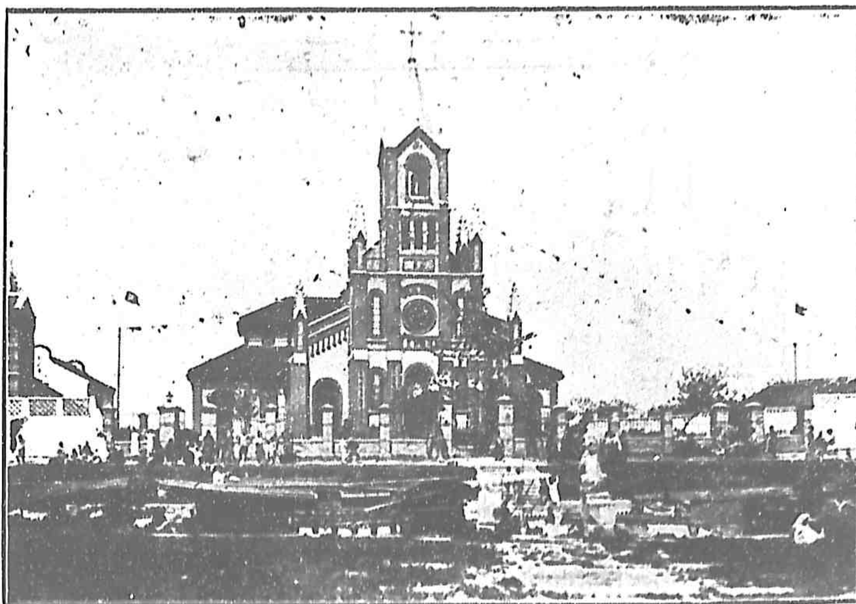
青 陽 新 堂