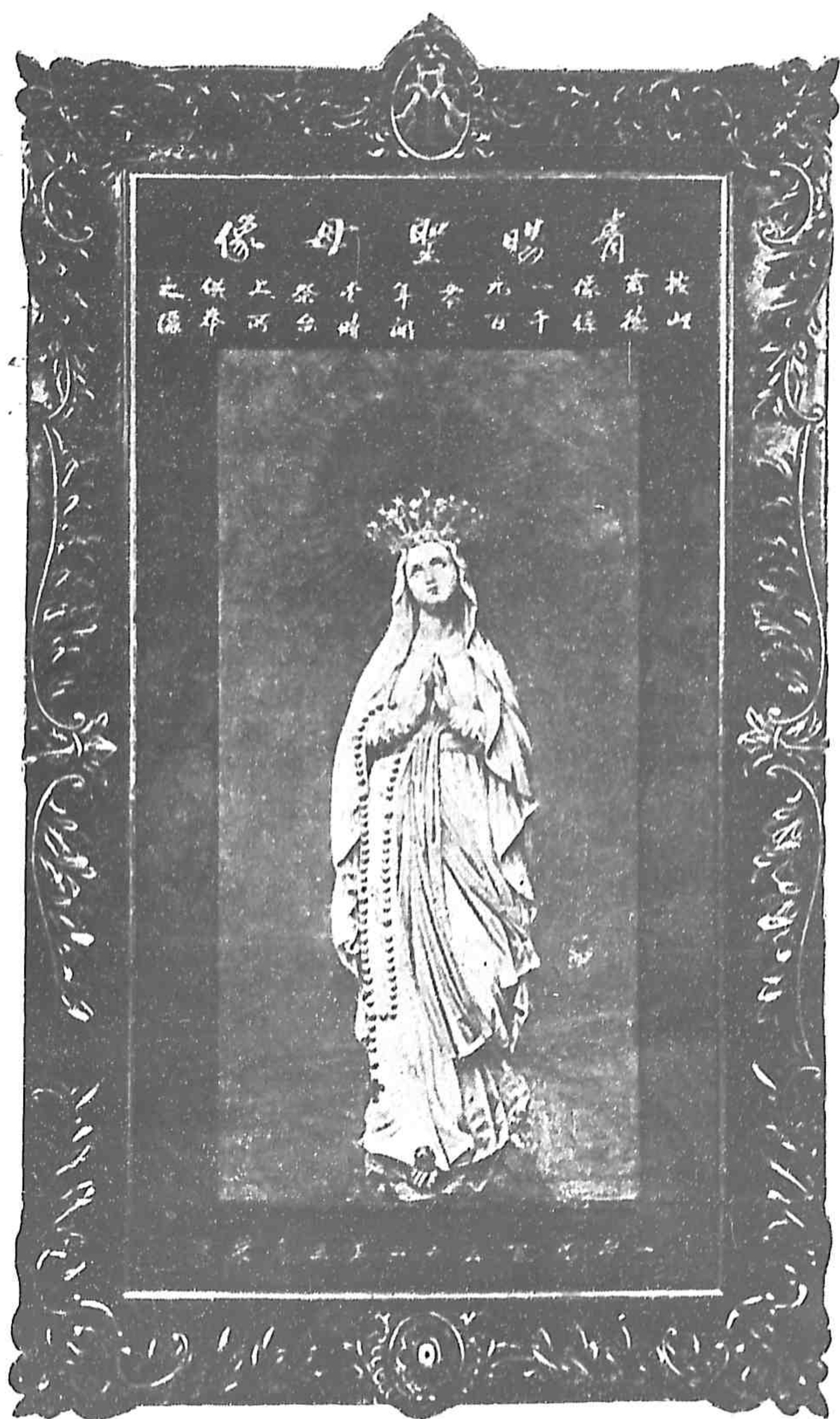
青 賜 聖 母 像