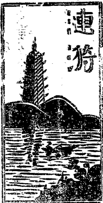
連濟 兵役法與民族救亡戰