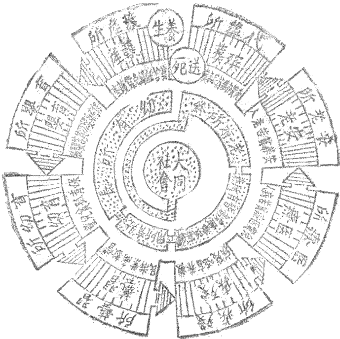
圖系體驗實院濟救驗實慶重部會社