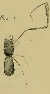
Fig. 1. Arundine flagellum quatuor Fig. 2. Arundine truncatus n. sp.