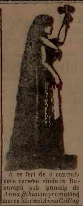
A se feri de o contrafacere care se vinde în București sub pumele de Anna Siklaimprumtând marca fabricii Anna Csillag