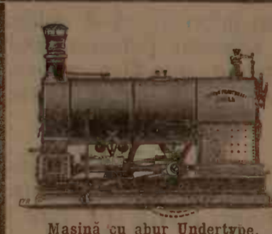
Mașină cu abur Undertype.