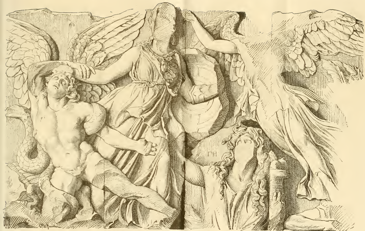
II. Athena gruppen.