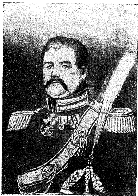
Генераль-лейтенантъ Иванъ Ефремовичъ Ефремовъ.