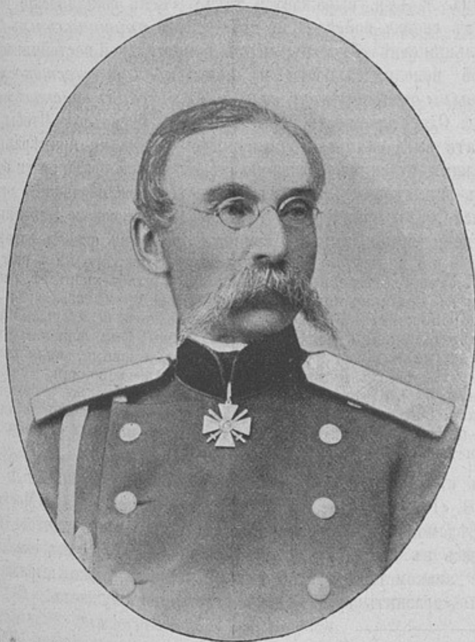
Состоящій въ распоряженіи Военнаго Министра, генераль-лейтенантъ Михаиль Трояновичъ фонъ-МЕВЕСЪ. Родился въ 1835 г. Произведенъ въ офицеры въ 1853 г.

Деньги могутъ быть высланы почтовыми марками, каждая не дороже 50 к. Безденежная подписка не принимается. За перемѣну адреса 28 к. Отдѣльные №№ высылаются за 15 к. Объявленія принимаются по особой расцѣнкѣ, высланной по требованію.