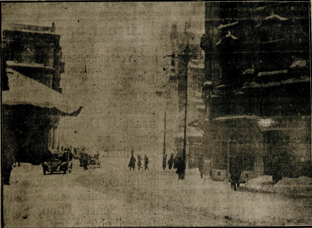
Bir kaç gündü beri devam eden kar sokokları temamiyle kaplamıştır. Karlar erimek şöyle dursun günden güne irtifaini artırmaktadır.