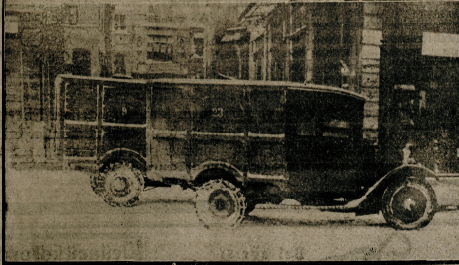
Son kar dolayısıyla şehrin bir çok yerlerinde ekmek ve et nedreti başlamıştır. Bunun üzerine öküz arabaları ile un ve otomobillerle et nakledimeğe başlamıştır.