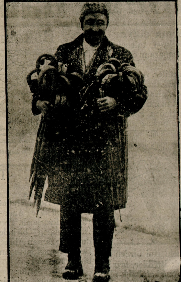
Yerler kaydığı için her gün yüzlerce kişi düşmektedir. Bastancılar bunu fırsat adderek sokaklarda ucuz fiatlarla bastan satmaktadırlar