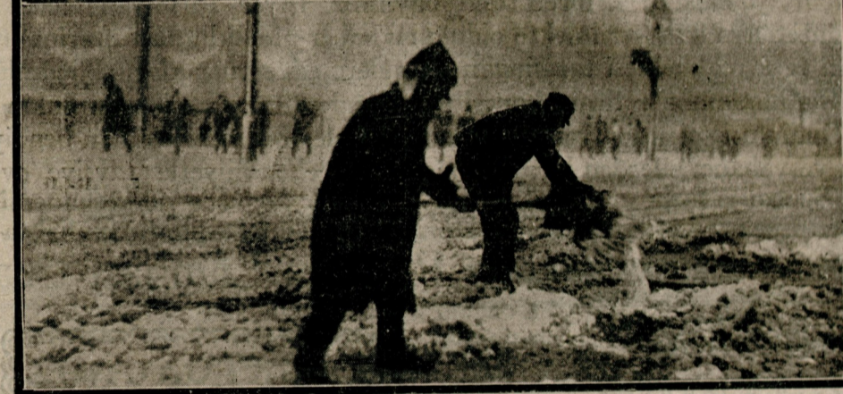
Emanet köprüdeki karları düü temizletmiştir, kaldırımların karları temizlenmiştir. Ameleler de caddelerde halka yol açmaktadırlar. Fakat bütün bunlara rağmen kar mütemadiyen yağmaktadır.