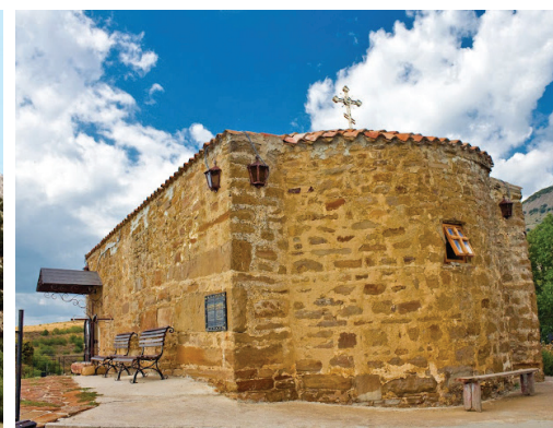
Храм святого пророка Іллі (Сонячна Долина) у наші дні