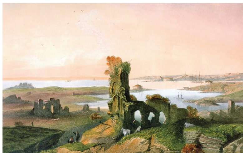
Карло Боссолі. Руїни Херсонесу. 1840-1842 рр.

Перший унійний єпископ Кафи згадується без імені у 1464-1465 рр., після того, як Віссаріон став титулярним латинським Константинопольським патріархом. По смерті цього єпископа у 1468 р. нового ієрарха мав обрати