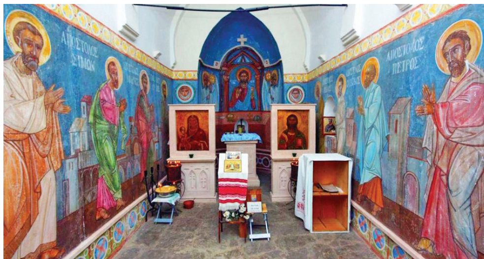
Сучасний інтер'єр Храму Дванадцяти Апостолів у Судаку. Відреставрований у 2006 р. з ініціативи Національного заповідника «Софія Київська» та музею «Судацька фортеця»

ЗАЗНАЧАЛОСЯ, ЩО МОДЕЛІ МОЖУТЬ ЗАЦІКАВИТИ НЕ ЛИШЕ ІСТОРИКІВ ЦЕРКОВНОЇ АРХІТЕКТУРИ ЗАГАЛОМ, А Й КИЇВ ЗОКРЕМА: БУЛО ЗРОБЛЕНО ПРИПУЩЕННЯ, ЩО КРИМСЬКІ ПЕЧЕРИ СЛУГУВАЛИ ПРОТОТИПОМ ДЛЯ КИЇВСЬКИХ