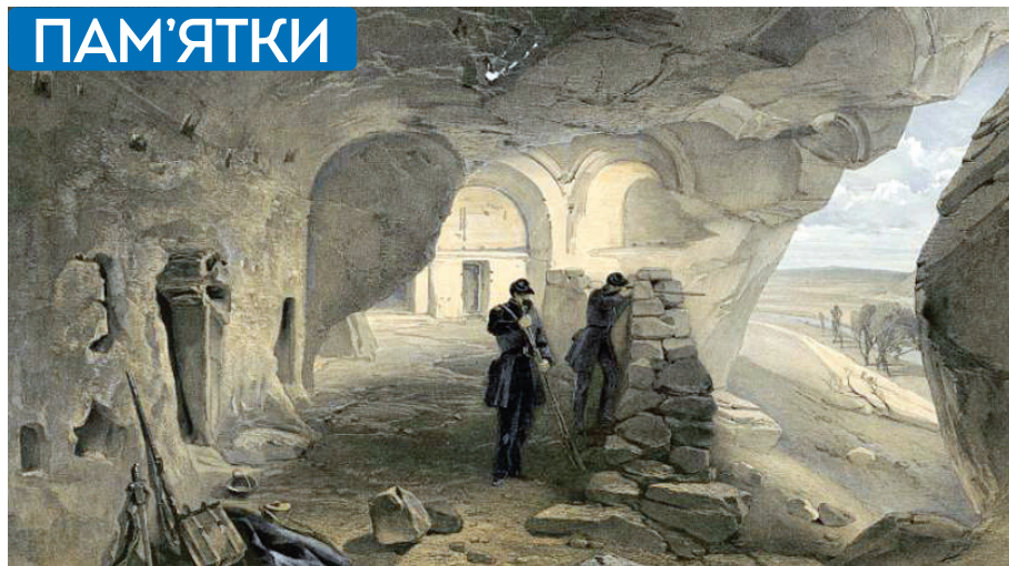
Вільям Сімсон. Печерний храм в Інкермані. Весна 1855 р. (під час Кримської війни)