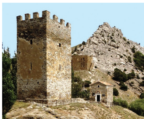
Храм Дванадцяти Апостолів у комплексі Судацької фортеці