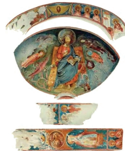
Мангуп. Південний монастир. Розпис печерної церкви.