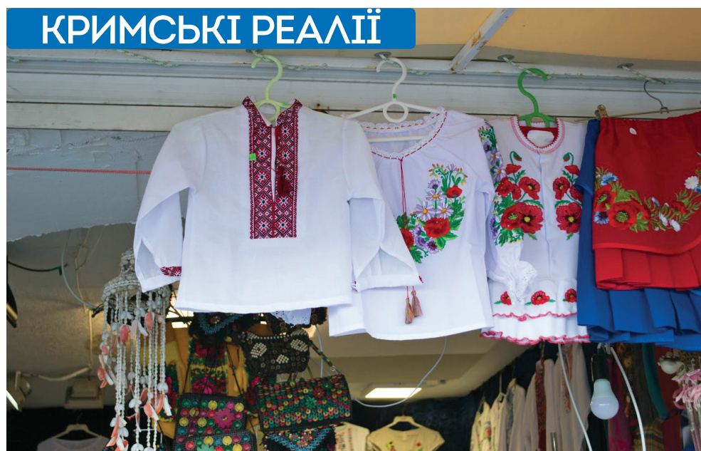
Українські вишиванки у павільйонах з сувенірами на набережній Корнілової

«Будь-яка пам'ять про "період окупації" ретельно, доволі методично і цілковито безжально зачищається. Це – "жива ініціатива знизу", що виконується з якимось абсолютно твердокам'яним, методичним спокоєм, який іноді навіть доходить до смішного», – стверджує публіцист. Ця зачистка часом справді набуває форм, які викликають неоднозначні почуття. Так, у вересні 2015 року один з місцевих блогерів оприлюднив фотографії українських охоронних табличок з державною символікою, що збереглися на стінах історичних будівель, супроводивши їх коментарем: «По городу достаточно много этой гадости, на которую тошно смотреть». У травні наступного року група вандалів самовільно скрутила подібні знаки з фасадів кількох будинків на проспекті Нахімова. «Наша акція – це