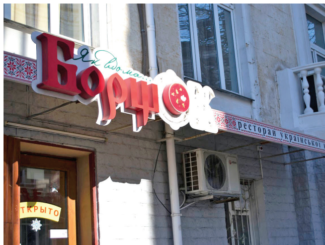
Ресторан української кухні «БорщОК» з буквою «Ц» у вигляді тризубця. Вулиця Айвазовського