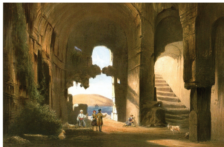
Карло Боссолі. Ранньохристиянська церква в Інкермані. Крим. 1840-1842 рр.

Невдовзі до Кафи, що номінально входила до Сугдейської єпархії, для православних греків почали призначати єпископа східного обряду, висвяченого Папою. Це призначення було започатковане за прямим посередництвом ініціатора Флорентійської унії – кардинала Віссаріона, який до того був православним архієпископом Нікеї: народжений у Трапезунті (сучасний Трабзон), він був пов'язаний зі своєю батьківщиною. На той час Кафа неохоче підпорядковувалася церковним ієрархам зuboжілої Сугдеї (сучасного Судака), де разом з усіма селами православних було значно менше.