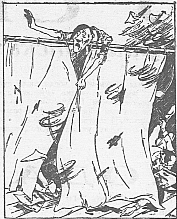
Гитлер: — Что вы! Что вы, господа! У нас все спокойно — никаких волнений... Рис. П. САРКИНСА.