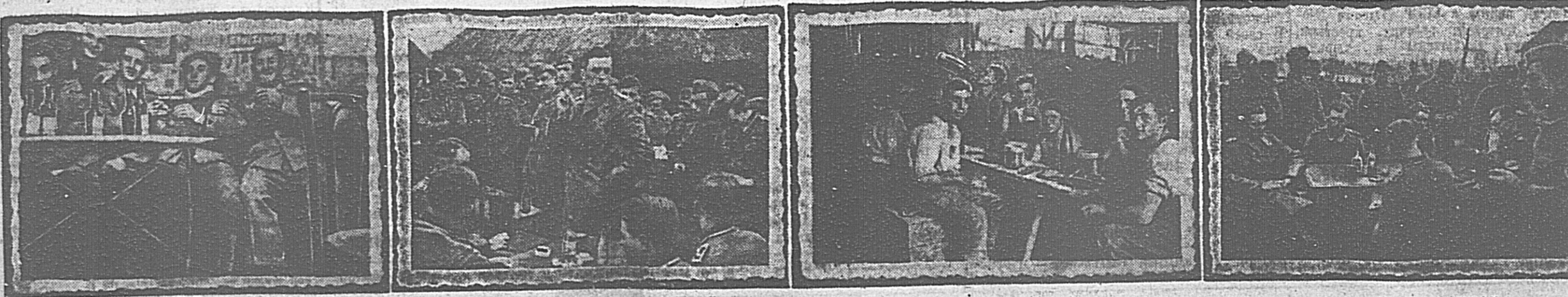
ОНИ ПЬЮТ В КАБАКАХ...