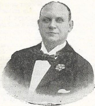
M. DEKERNEL Micromégas

POUR LA PUBLICITÉ, S'ADRESSER A L'AFFICHAGE FRANÇAIS 62, Rue Tiquetonne. — Paris OU AU CHATELET