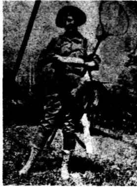
桃色債的主角瑪琪伯照張片是在死者陶尼的袋裏發現的現狀