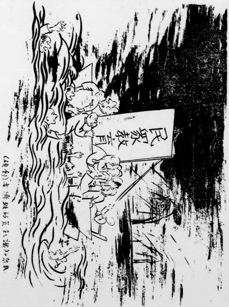
(原創) 老濟救的荒知識衆民