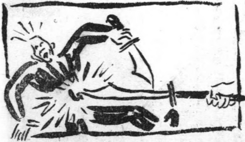
勤刀者必死手刀 (太二六五二)

快樂的，不但是因為傳道與神同工，盡了本分，使靈命增長而快樂。更是有神最後賜冠冕為賞賜的應許而快樂。保羅又說：「現在的苦楚若比起將來要顯於我們的榮耀，就不足介意了。」傳道雖屬至難，但是，因為有將來得榮耀冠冕為賞賜的盼望，所以也就不足介意了。反倒因為有得榮耀冠冕為賞賜的盼望，於是一切苦楚便會於無形之中冰消瓦解了。傳道人有這樣大的盼望，豈能不快樂嗎？