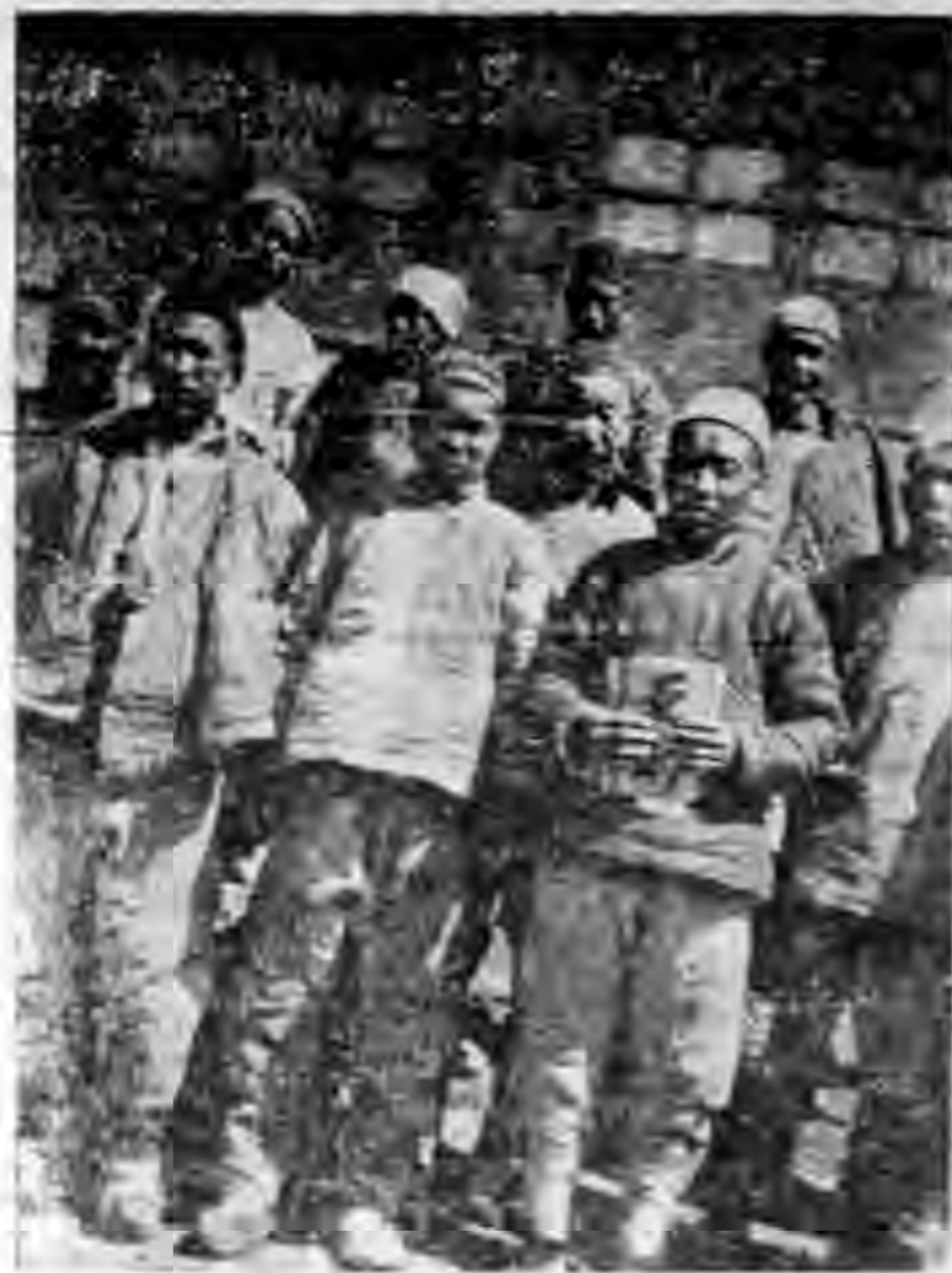
察省 張北 縣各 互助 社代 表發 訂合 同情 形。

答：現在關於農業常識的書籍很多。南京金陵大學農學院有出版的幾種小冊子，如農林淺說，與農家淺說等，所記載的材料都很合實際，若諸位有意改良農業，可直接向該校函索，並不收費，又上海中華書局出版的有以下幾種：1 農業寶鑑，陸