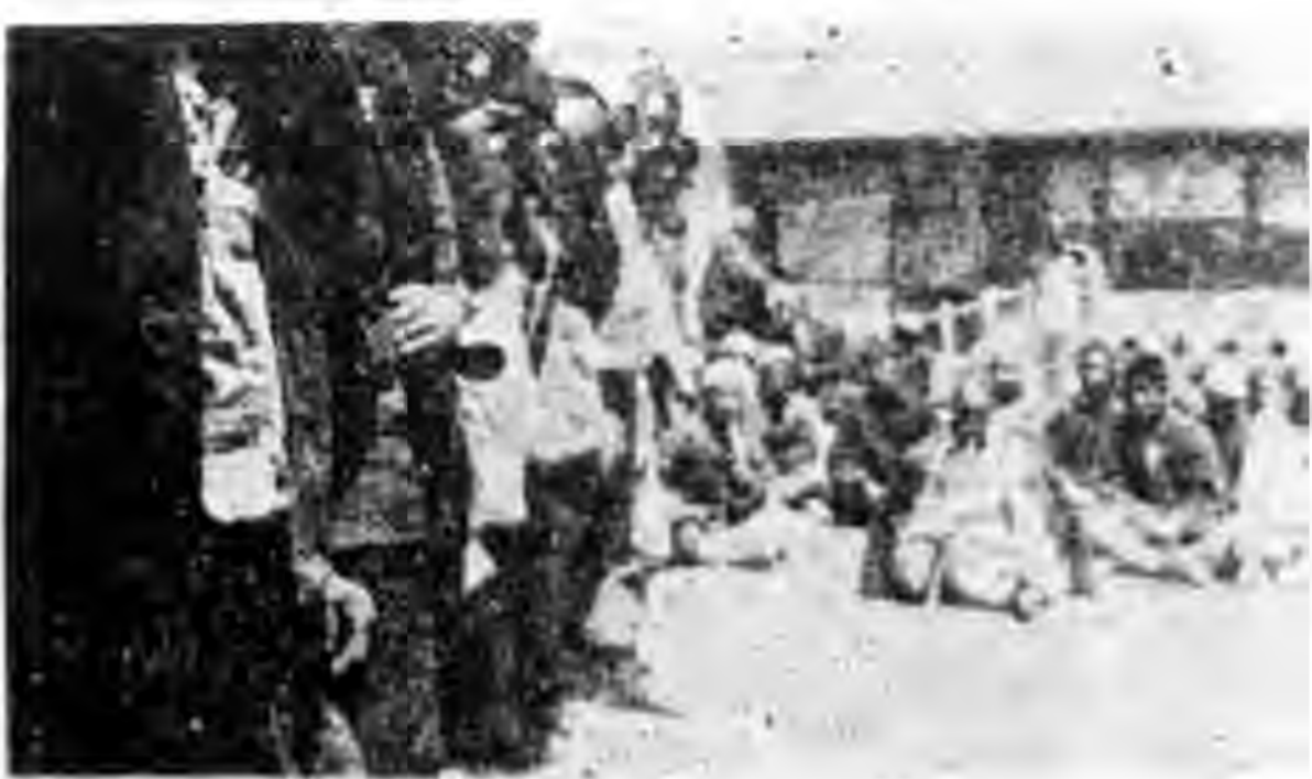
察省商都各縣互助社代表齊集領取賑款

況且為鷄灌藥又不是一件容易的事。弄得不好。鷄病未除。而人反受了傳染。那才是最危險的。最好的辦法。是能事先加以預防。現在對大家談一談預防鷄瘟的法子。