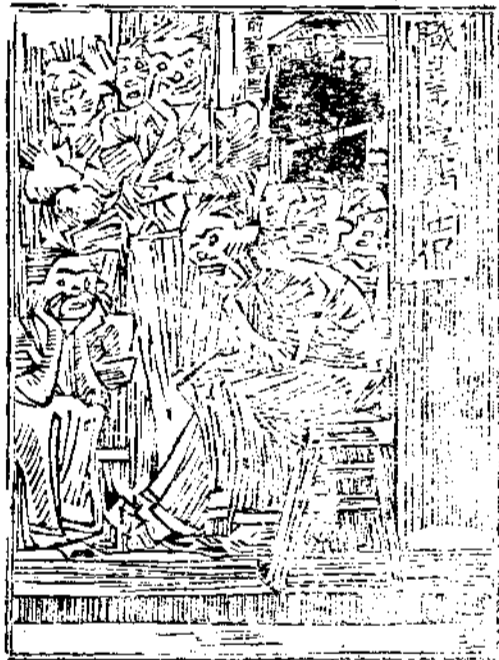
(報品載轉 責其負誰)

打倒貪污是多年的口號，而且各項法規，也應有盡有。但貪污豪奪之風，何以不稍見斂迹，溯其淵源，則是在政務官既不尊重法規，而且本身也不能為廉潔之倡，這種種豆得豆，種瓜得瓜的因果律，我們也無需來論述他的不幸的前途的，因為有無窮的