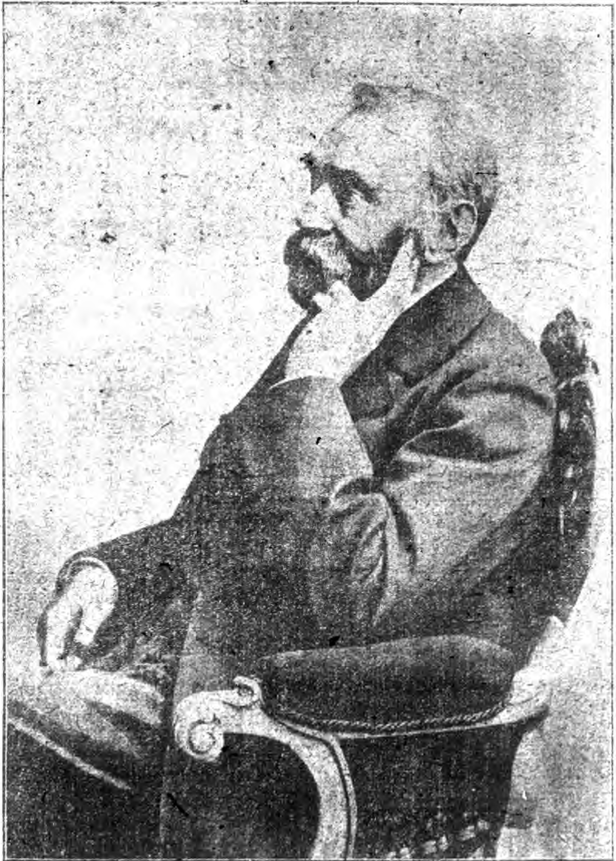
那 比 爾