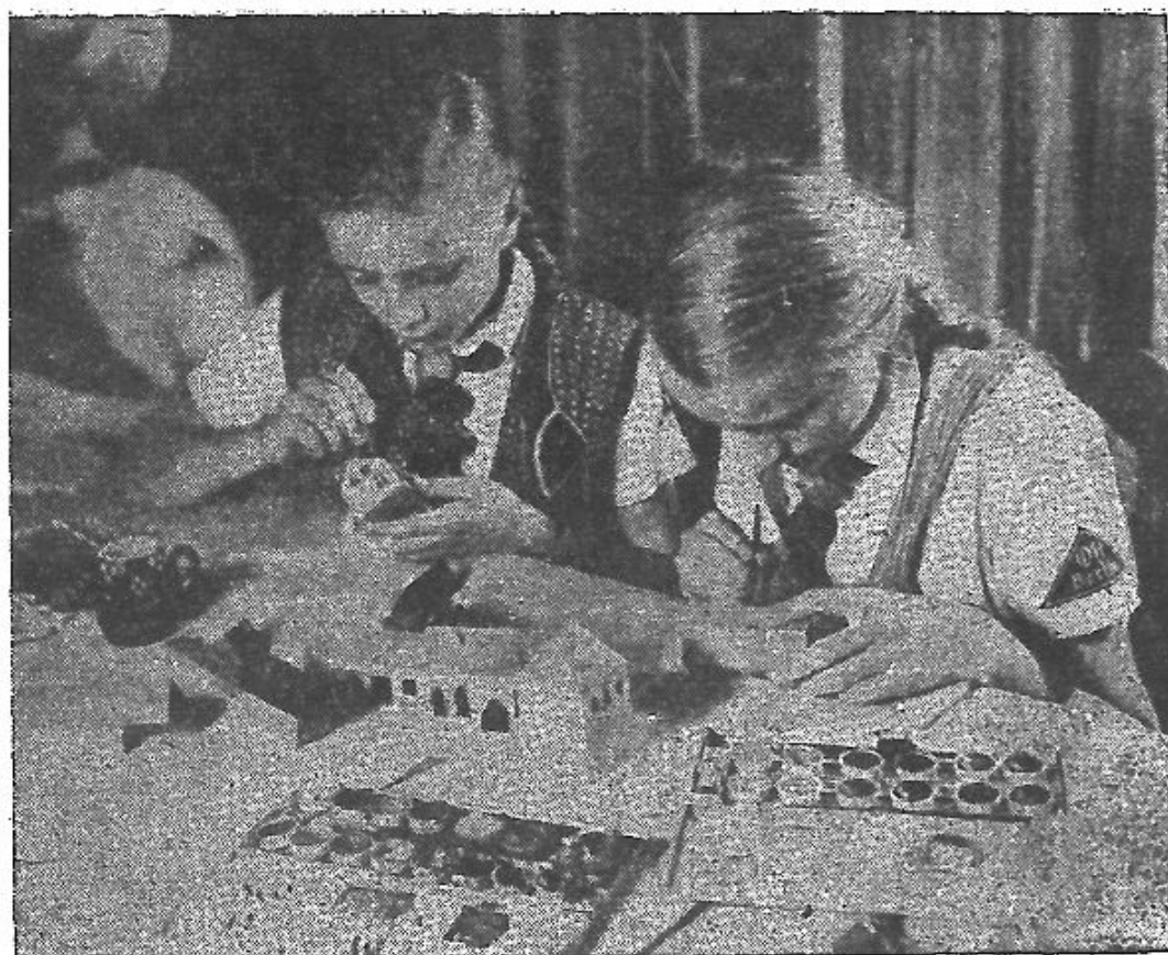
少女團團員之縫紉及製裁工作