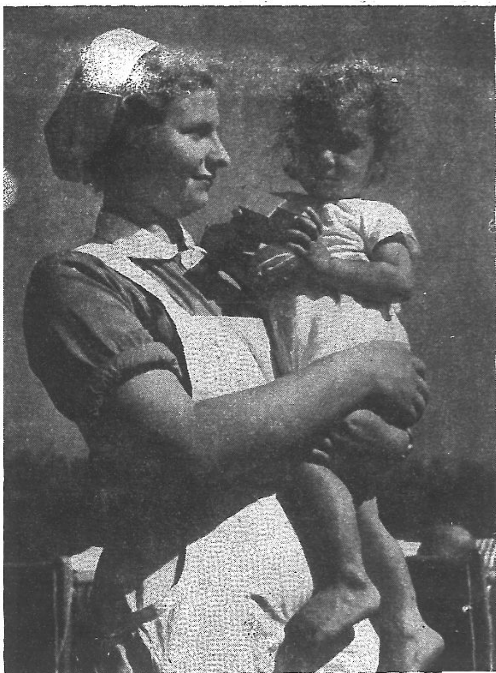
護士育兒實習醫藥保養的初步知識