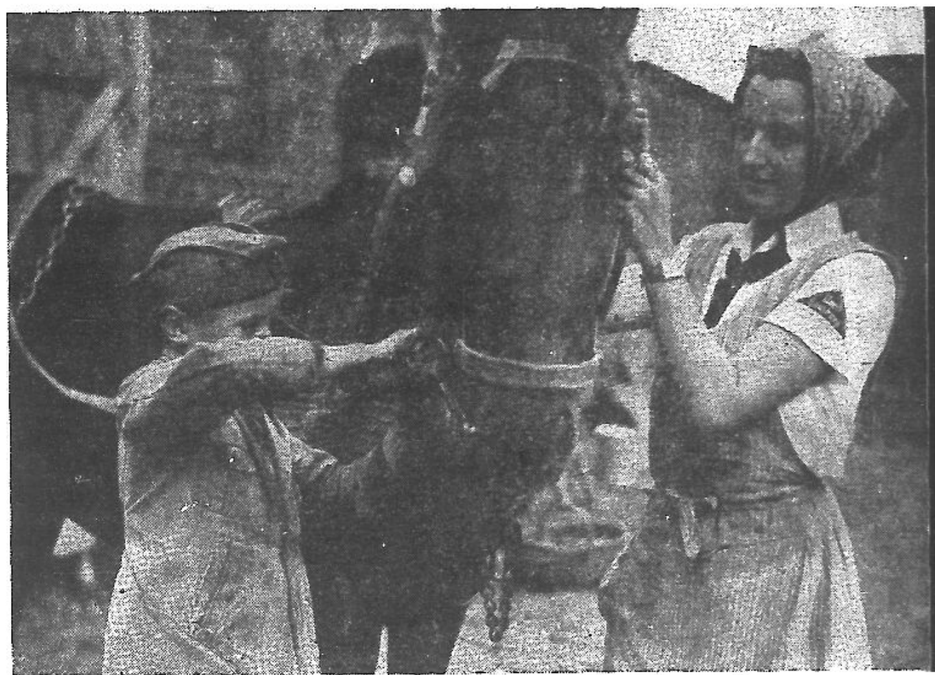
青 蹈 春 遊 為 單 不 外 郊 騁 馳 們 女 少