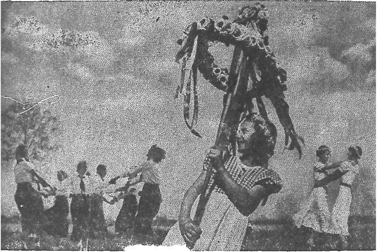
益俾有大身心於樂舞的中媚明光春