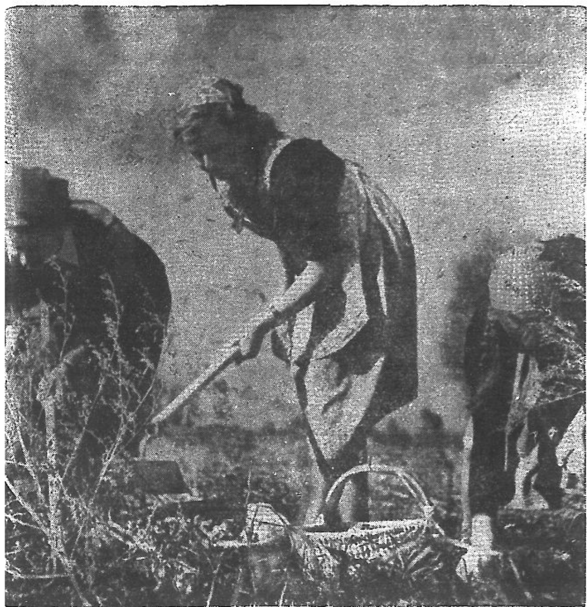
耘耕婦農助協員團團女少