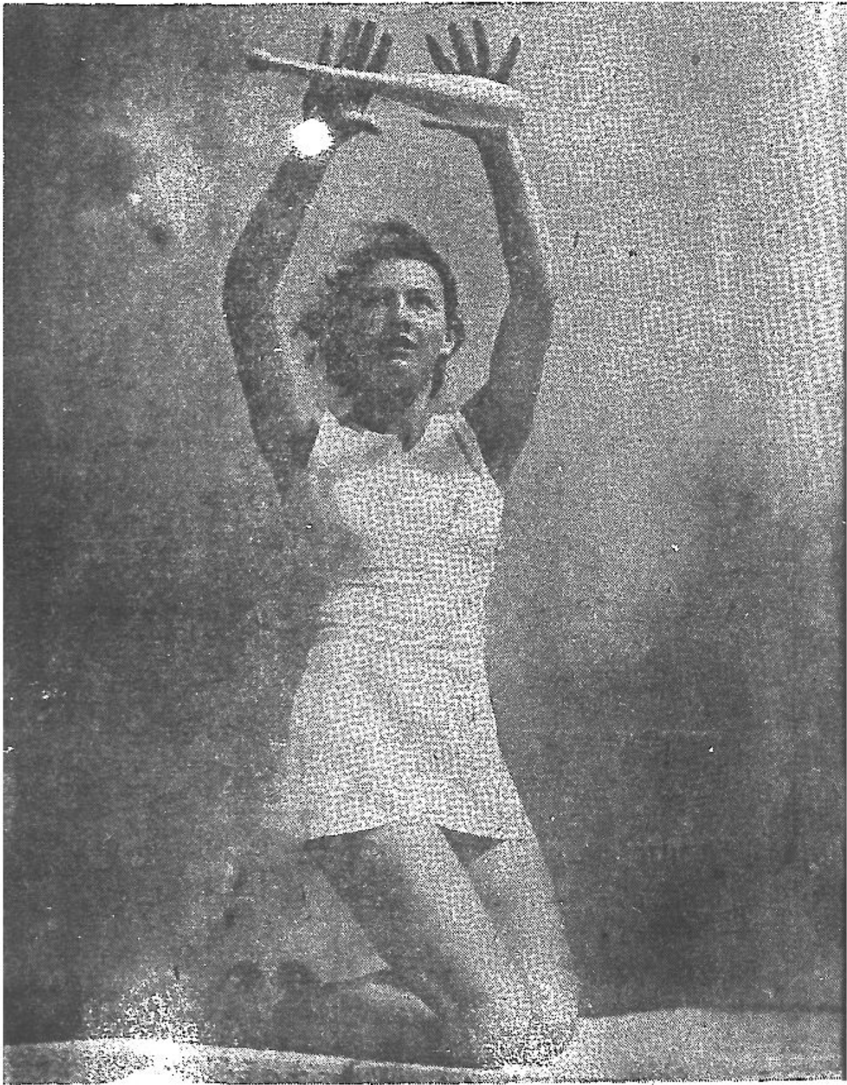
課修必的體身鍊鍛是操體晨每們女少