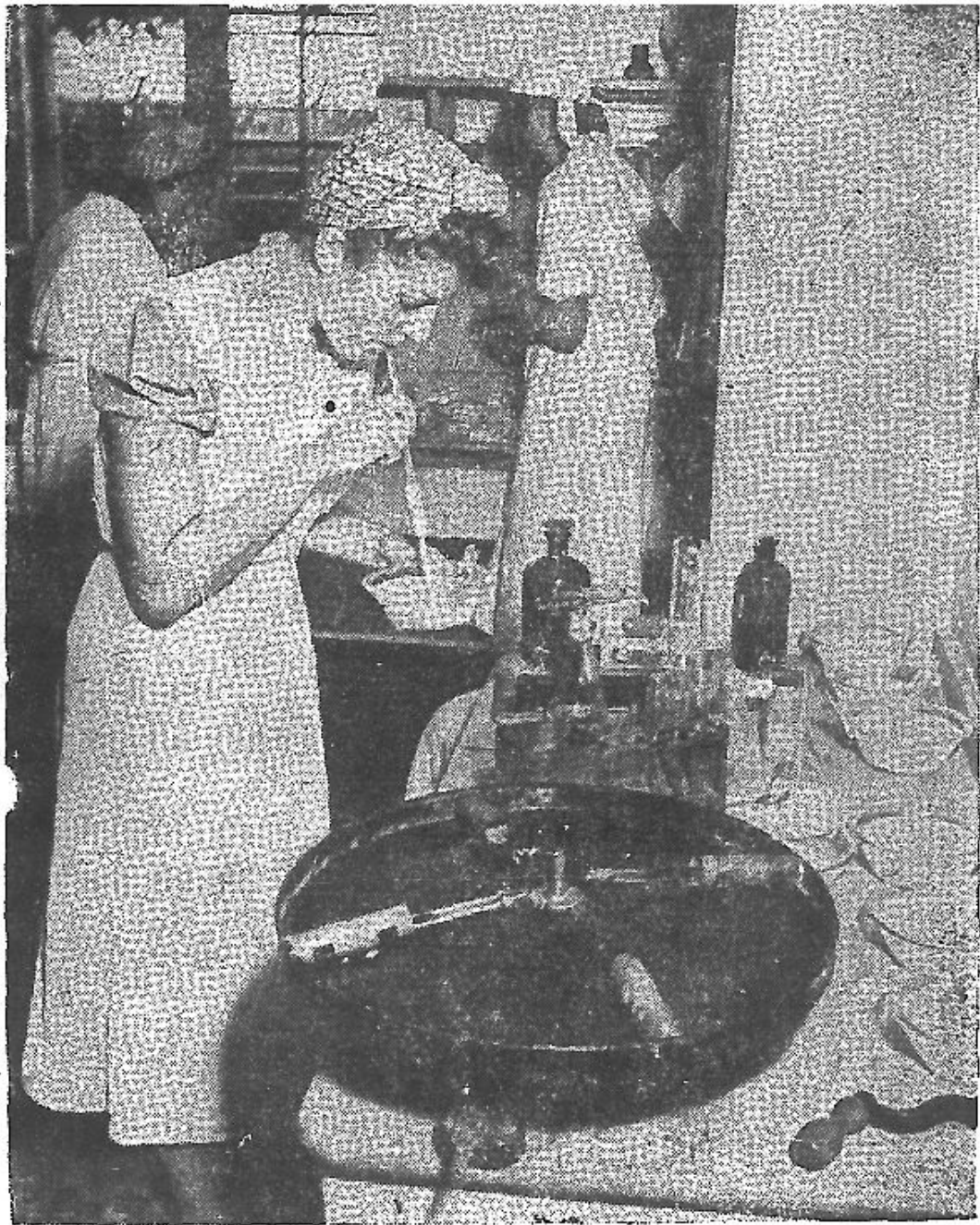
係關大極有上養營與擇撰驗化的品食