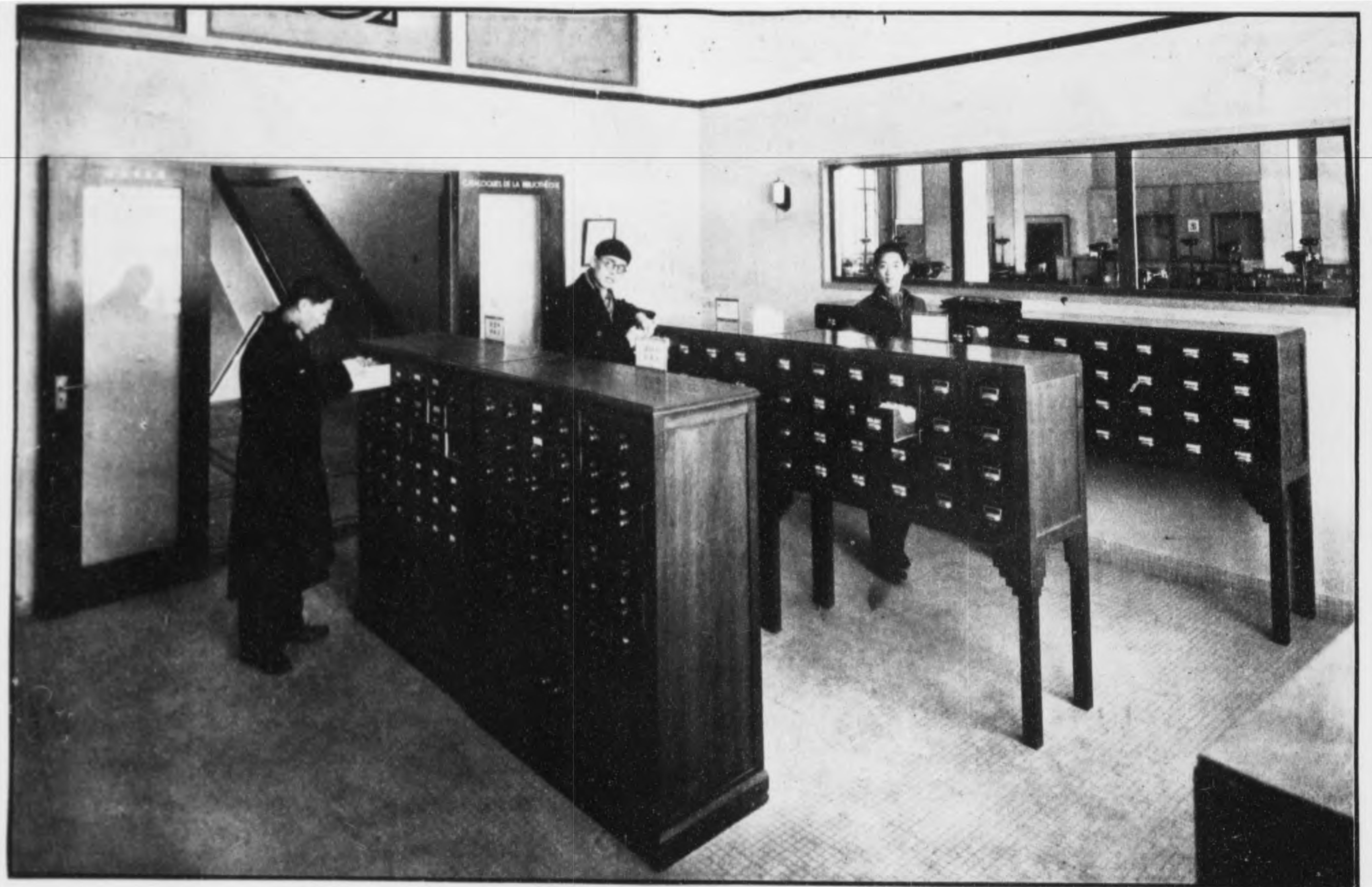
目 録 室