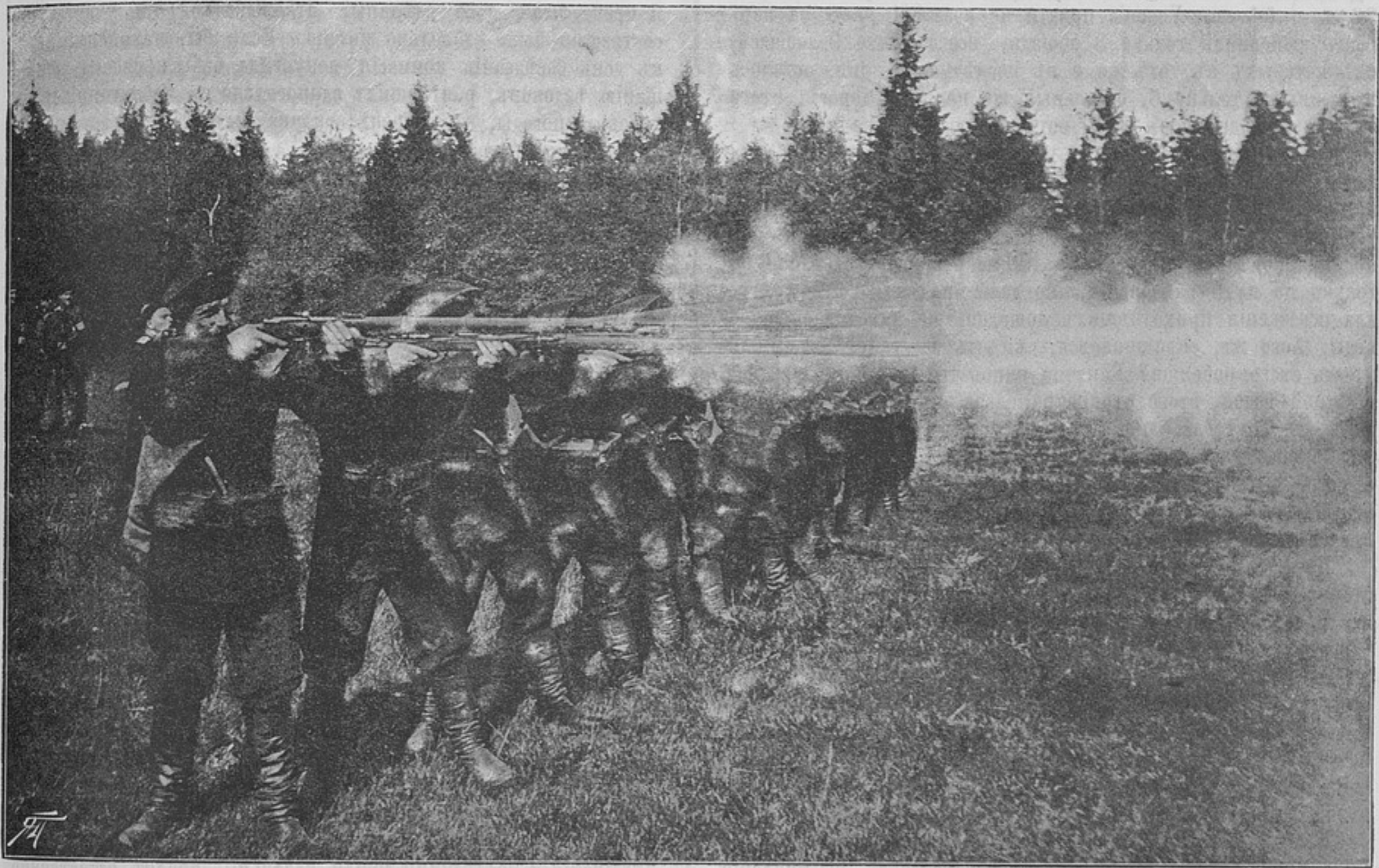
Залпъ изъ Берданки.

Ѣздоки не допускались на совѣщанія комиссіи и узнали избранную дорогу только за недѣлю до скачки, а часъ старта лишь за три дня.