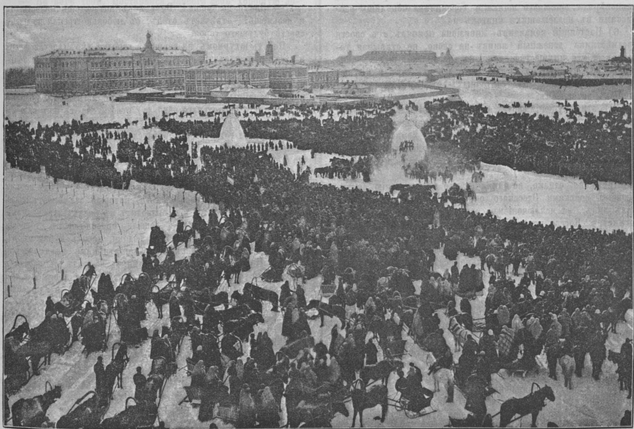
Взятіе снѣжнаго городка 1 (къ статьѣ «Снѣжные городки»).

Денги могутъ быть высланы почтовыми марками, каждая не дороже 50 к. Безденежная подписка не принимается. За перемѣну адреса 28 к. Отдѣльные №№ выслаются за 15 к. Объявленія принимаются по особой расцѣнкѣ, высланной по требованію.