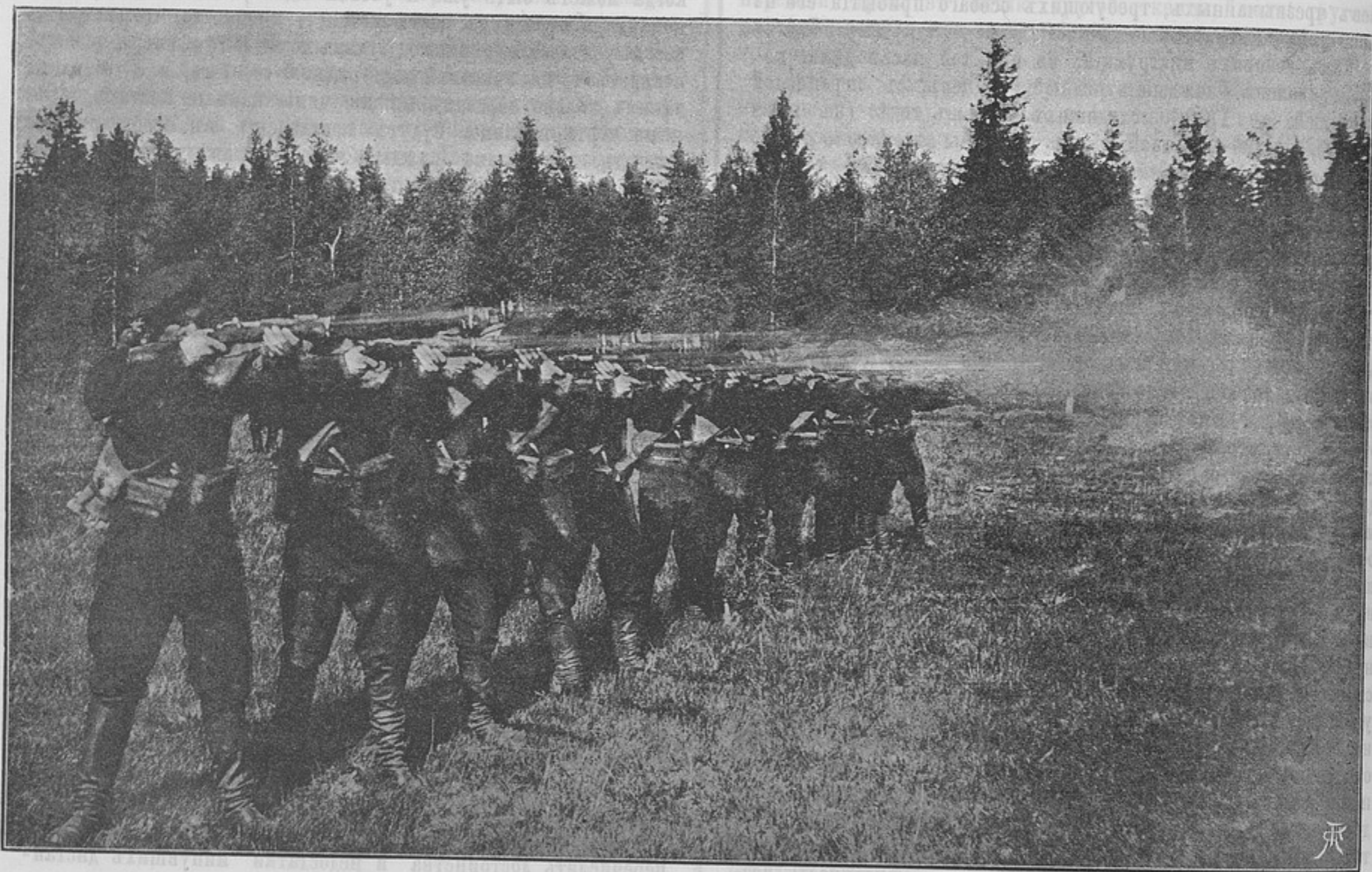
Залпъ изъ новой 3-хъ-линейной винтовки.

Такъ какъ никто изъ ѣздоковъ раньше не имѣлъ случая принимать участія въ подобныхъ скачкахъ, то естественно, что сколько было ѣздоковъ, столько же было теорій подготовки лошади и предположеній о ходѣ скачки. Была даже такая рѣзкая разница взглядовъ, что иные собирались по дорогѣ отдыхать и кормить лошадь, другіе же предполагали идти безъ остановокъ, дѣлая порядочные репризы галопомъ; согласно этимъ взглядамъ была замѣтна разница и въ тѣлахъ лошадей, изъ которыхъ однѣ смотрѣли довольно сырыми, другія слишкомъ перетренированными и очень мало было ло-