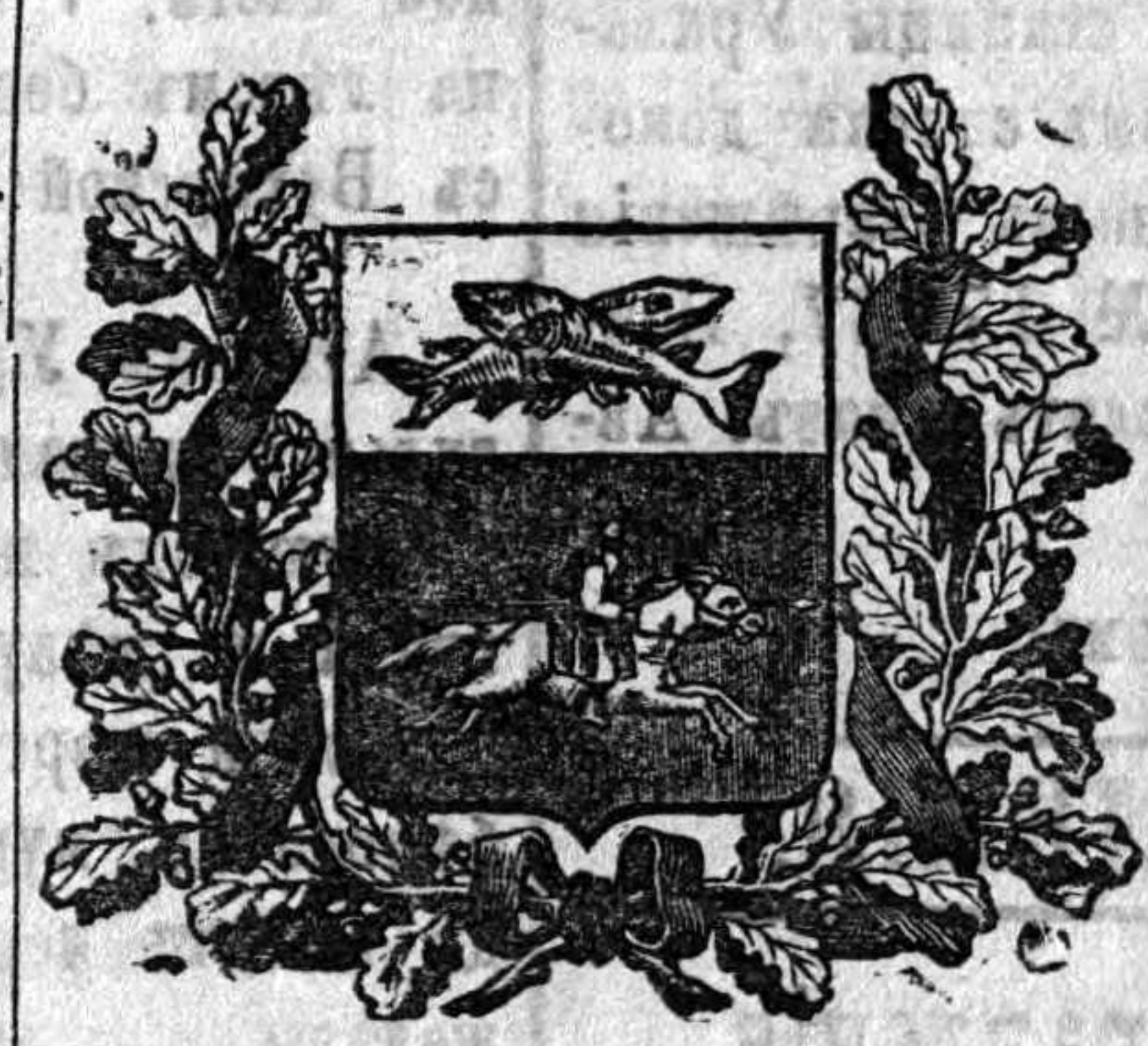
100 №№ ВЪ ГОДЪ.

Для живущихъ въ войскъ — въ редакціи, — при Типограф. Урал. каз. в.. а также у стан. атаман. Иногородніе адресують исключит. въ Редакцію.