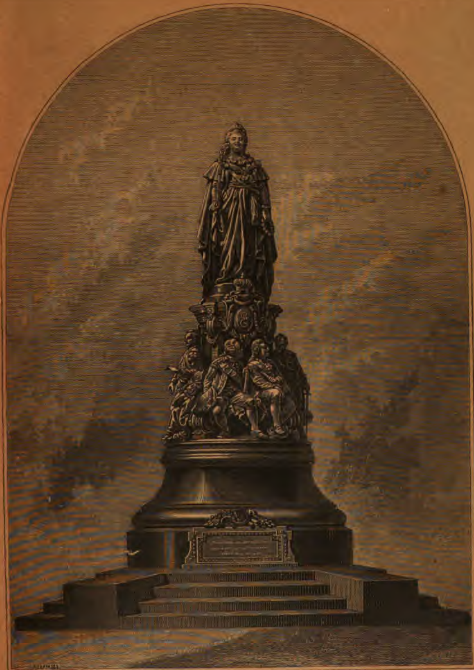
ИМПЕРАТРИЦЪ ЕКАТЕРИНЪ П-я ВЪ ЦАРСТВОВАНИЕ ИМПЕРАТОРА АЛЕКСАНДРА П-го 1873 г.