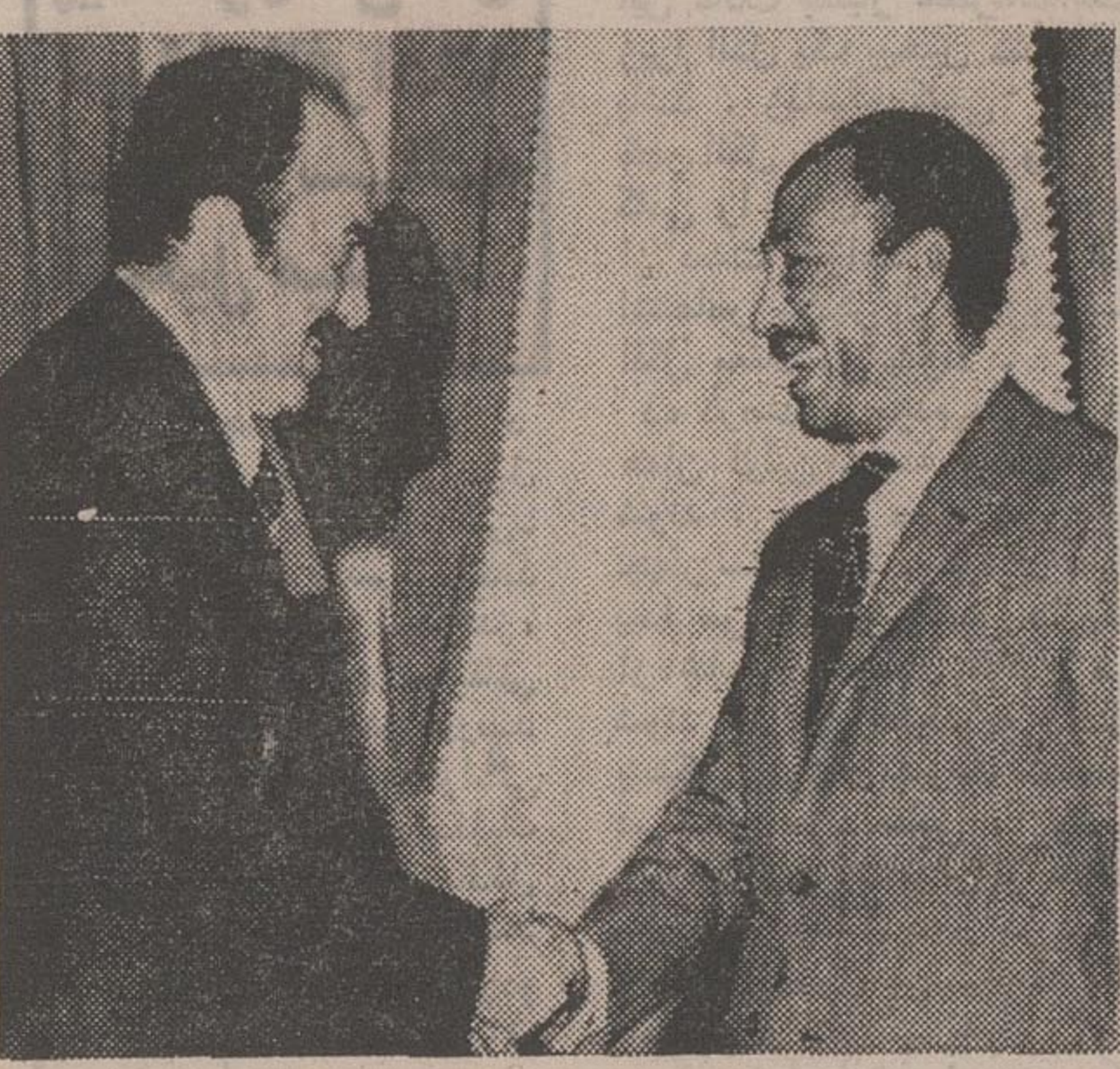
علیرغم مبارزه ضد ناصری که در مصر جریان دارد دیروز انور سادات رئیس جمهوری مصر کمال شلیطه رهبر سازمان هواداران ناصریسم لبنان را پذیرفت و با وی بیگفتگو پرداخت در عکس‌سادات و کمال شلیطه هنگام این ملاقات دیده می‌شوند.