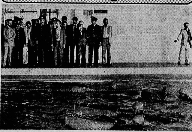
در دانشگاه اسری، عملیات تمرینی جنگی، در حضور نخست وزیر، به نمایش گذارده شد.

چشم فارغ‌التحصیلی دانشگاه اسری نیروی زمینی بعد از ظهر دیدار محل این دانشگاه، بازگردد شد و سمنند بازرگان نخست‌وزیر پس از شنیدن گزارش سربست دانشگاه اسری گواهی نامه هسای فارغ‌التحصیلان را به‌همان بپ و همچنین جوایز دانشجویان ممتاز را به آنان اعطا کرده.