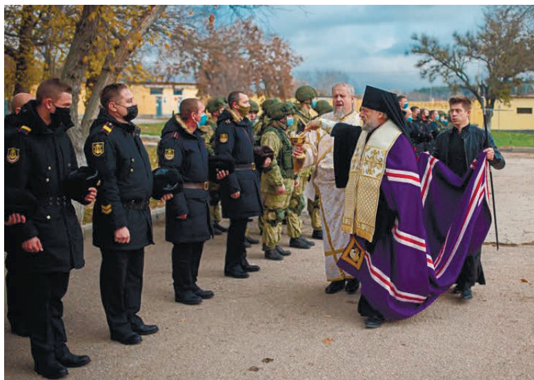
Освячення каплиці в ім'я «святого благовірного» князя Андрія Боголюбського у 4 полку радіаційного, хімічного та біологічного захисту ЧФ РФ в окупованому Севастополі, 01.12.2020.