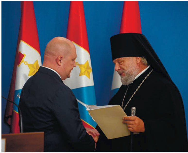
Вручення привітання предстоятеля РПЦ патріарха Кирила новопризначеному «губернаторові Севастополя» Михайлу Развожаєву в Катерининській залі Будинку офіцерів флоту, 02.10.2020.