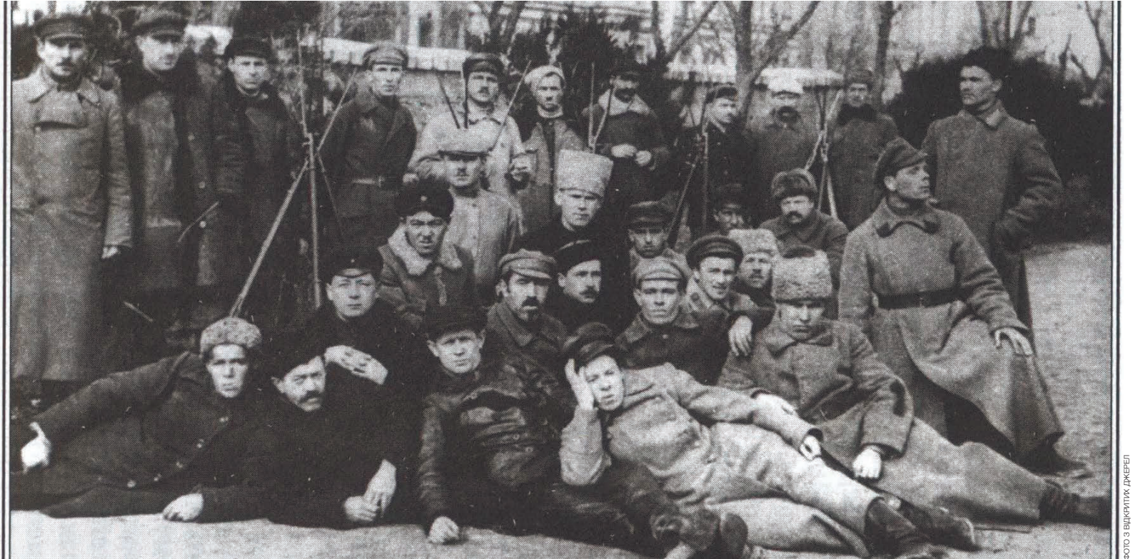
1-ша рота 2-го гірськострілкового батальйону, що знищувала залишки білогвардійців у кримських лісах і горах. Фото 1921 р.