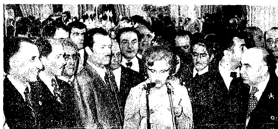
جمشید آموگر، کار نخست وزیر، جمعی از مقامات مملکتی، نویسندگان و شعرا در شب که از طرف امیر عباس هویدا وزیر دربار شاهنشاهی به مناسبت صدمین زادروز رضاشاه کبیر در کاخ گلستان ترتیب داده شده بود، شرکت کردند. در عکس بالا خام نیره سعیدی هنگام ایراد نطق دیده می شود.

از سوی وزارت دربار شاهنشاهی، به مناسبت صدمین سالگرد زادروز امیرعباس رضاشاه کبیر عصر دیروز مراسم ویژه ای در کاخ گلستان برگزار شد که در آن دکتر جمشید آموگر، نخست وزیر و دبیر کل حزب رستاخیز ملت ایران، رؤسای دومجلس، وزیران، سناتورها و نمایندگان مجلس شورای ملی و پیش از یکشنبه و ششمین روز از شاعران، نویسندگان، هنرمندان و طیفات مختلف مردم شرکت داشتند.