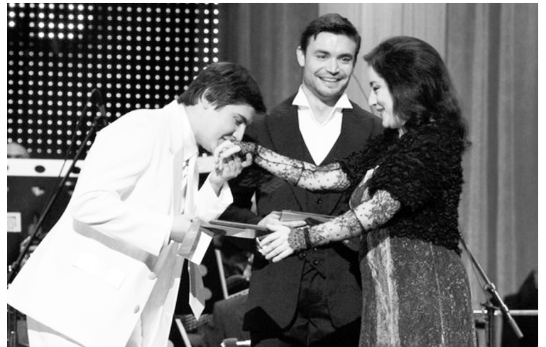
На Міжнародному конкурсі вокалістів.

Коли закінчив роботу, то хотілося, щоб ці пісні почули