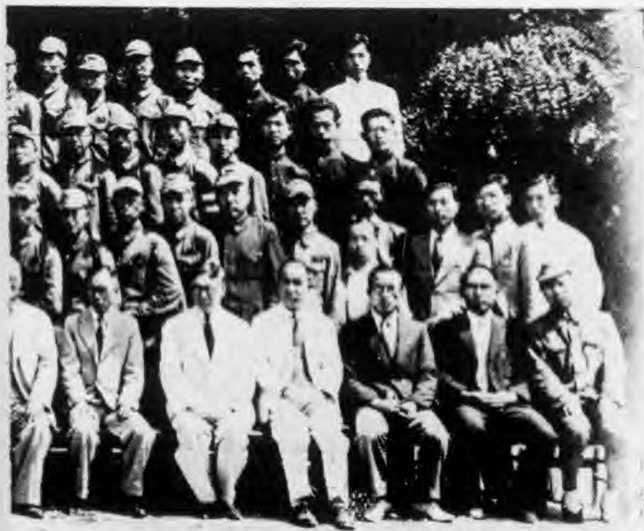
總會合作人員養成所第一期畢業典禮