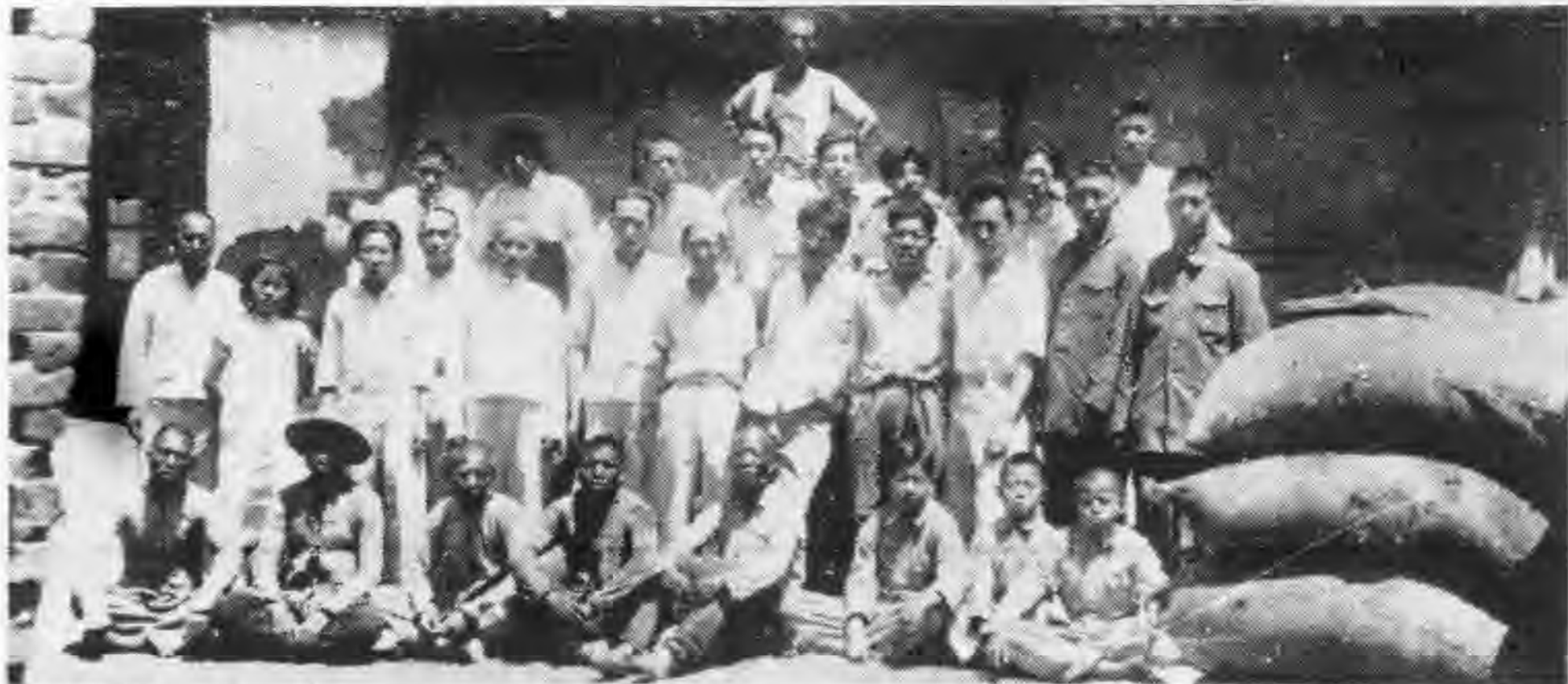
成安縣聯事業系食糧分配工作