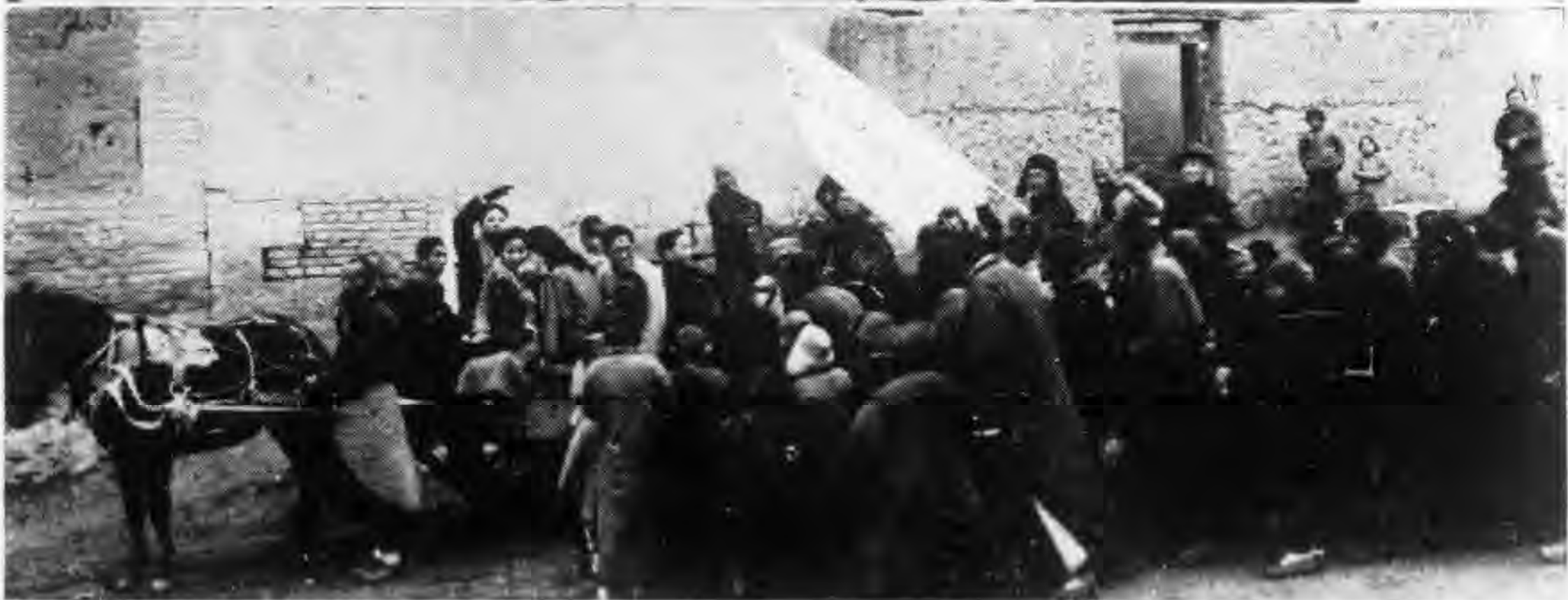
▷ 新鄉縣鄉村合作社改組時選舉職員之一幕