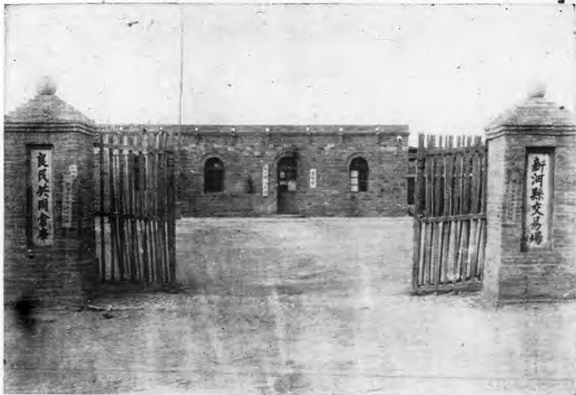
新河縣聯新落成之交易場