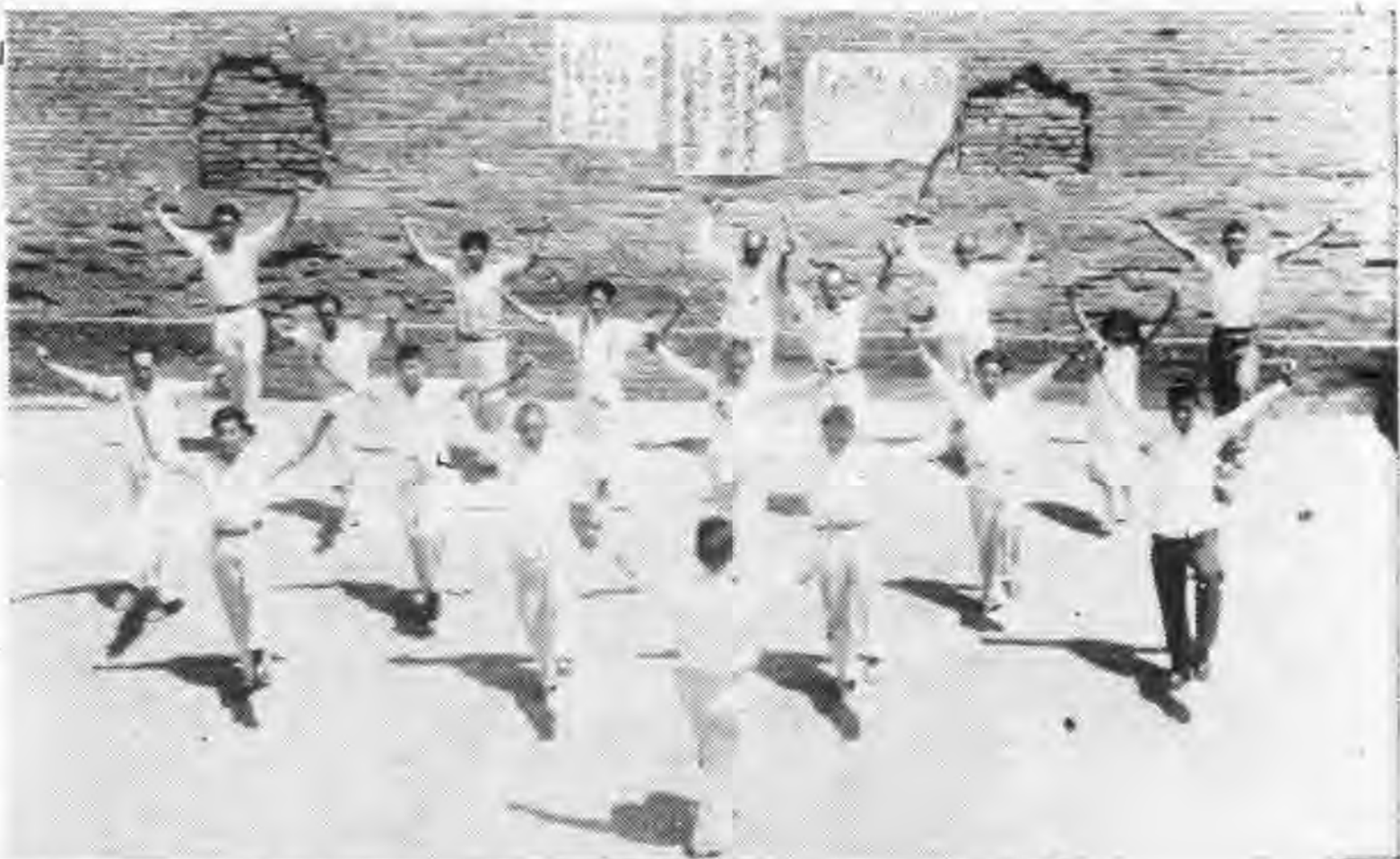
成安縣聯職員早操姿勢