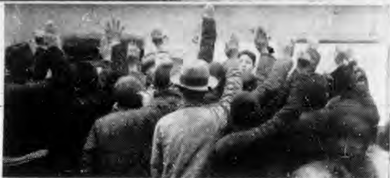
▷ 新鄉縣聯鄉村合作社改組班受鄉民歡迎情形