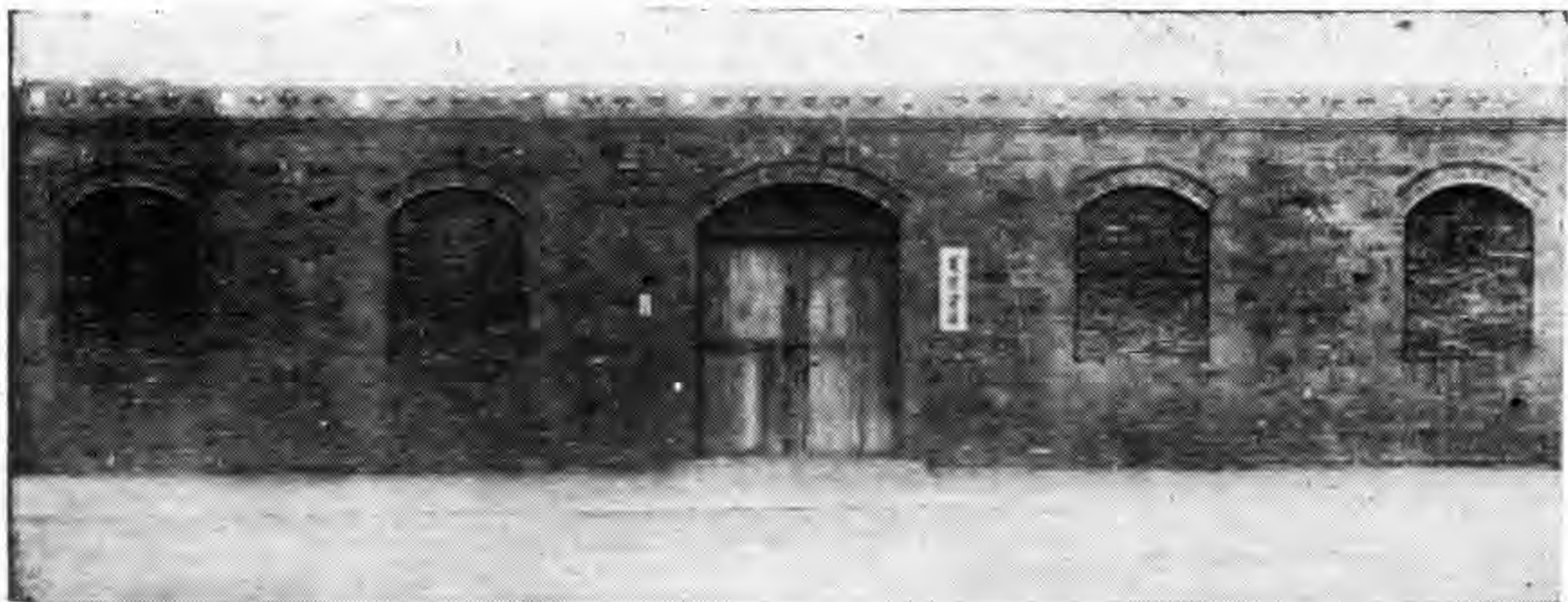
業倉庫(左上)及職員 宿舍(左下)