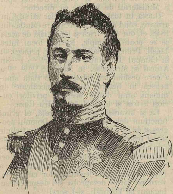
ALEXANDRU IOAN I CUZA.

rul tineretelor sale; numai după ruperea legăturilor sale cu Domnul și începerea prigonirilor împotriva lui, el începu să pledeze ca avocat. Și Cuza învățase dreptul, și nu era lipsit de talentul vorbirii; firea