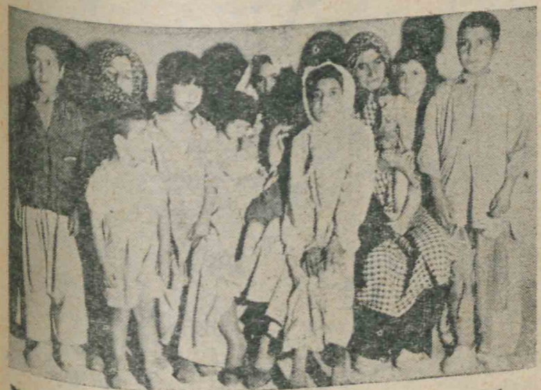
گروهی از بازماندهگان شهدای سی ام تیر در انتظار مجازات جنایتکاران روز شماری می کنند