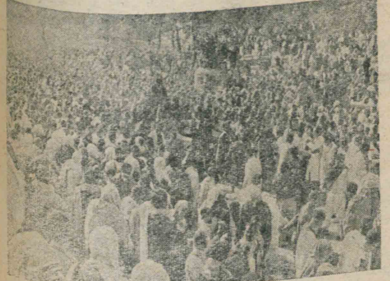
جمعی از فرزندان قهرمان تهران که با فریاد یامرک یا مصدق در روز سی ام تیر مبارزه شرافتمندانه خود ادامه میدهند