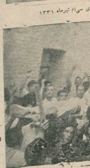
گروهی از فرزندان کفن بوش وطن که باخون و آتش بنیان حکومت ملی را در روز سی ام تیر ماه ۱۳۳۱ بی کزاری کردند

سدهی اسکندری یکی از شهدای سی ام تیر ماه ۱۳۳۱