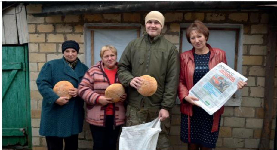
Офіцери груп цивільно-військового співробітництва доставляють гуманітарні вантажі в населені пункти «сірої зони»

Проблеми офіцерам групи цивільно-військового співробітництва доводиться вирішувати будь-які. Приміром, незабаром розпочнуться посівні роботи. Перш ніж вирушати на поля, селянам потрібно визначитися, де можна обробляти землю, а де вона замінована. У такому випадку голова райдержадміністрації скликає спеціальну нараду за участі керівників сільськогосподарських підприємств та фермерських господарств, на яку запрошують і представника CIMIC. Йому нада-