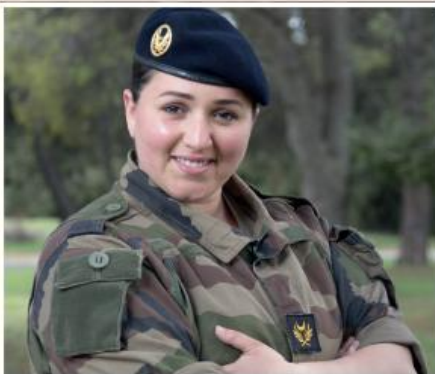
У це непросто повірити, але у світі існують і мусульманські військові капелани – жінки. Ця, наприклад, служить на французькій військовій базі в Турі – місті, де жив сам святий Мартин