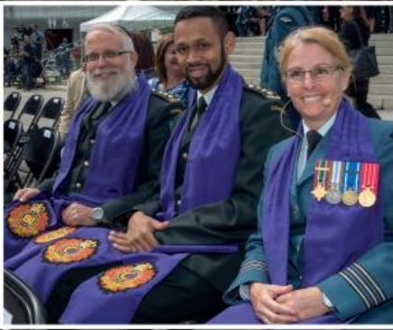
Військові капелани різних видів військ Збройних Сил Канади