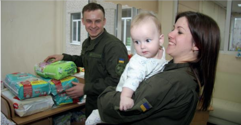
Військовослужбовці ЦВС НГУ в гостях у вихованців Луганського обласного будинку дитини №2, евакуйованого до Сєвєродонецька

голова поскаржився підполковнику Соколовському на те, що у громадських місцях нерідко вештаються нетверезі люди у військовій формі, що поводяться неадекватно. Було вирішено запросити усіх підприємців міста, які торгують спиртним, на імпровізовану нараду за участю представників поліції і домовитися не відпускати людям в одностроях алкогольні напої. При цьому населення попередили, що персонал CIMIC спільно із поліцією бере ситуацію під контроль. Після цього ганебних вчинків поменшало в рази.