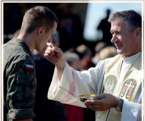
Польський військовий капелан причащає солдата під час святої меси