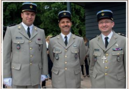
Французькі військові капелани – юдей, мусульманин і католик