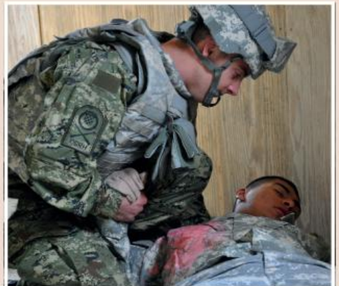
2012 рік, Німеччина, перші багатонаціональні тактичні навчання військових капеланів. Представник Хорватії надає пастирську підтримку «пораненому» солдату.