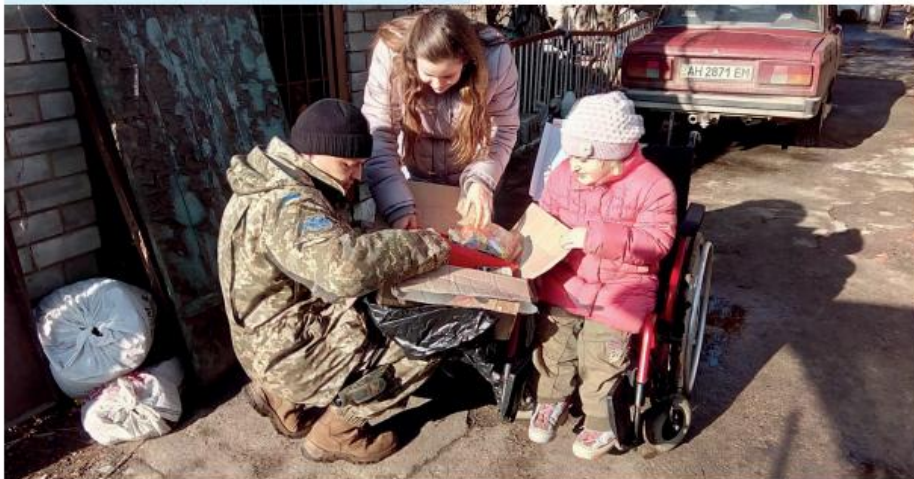
Позаштатні групи ЦВС ЗСУ почали працювати вже в перші місяці збройного конфлікту на Донбасі. Згодом їхню діяльність було регламентовано на рівні Міноборони. З 2017 року група ЦВС діє в НГУ

Таким чином, весь персонал груп цивільно-військового співробітництва, котрі працюють в районі АТО, має пройти відповідну підготовку. Військовослужбовці вивчають керівні документи, що регламентують їхню роботу, знайомляться з порядком ексгумації та евакуації тіл загиблих, розглядають питання координації груп CIMIC з місцевою владою, міжнародними та вітчизняними громад-