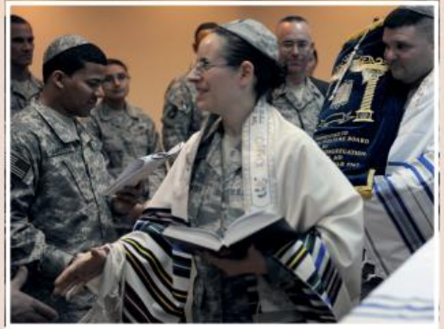
Американський юдейський капелан в Іраку

У військових формуваннях зарубіжних держав служать капелани, що сповідують різні напрями християнства – католицизм, православ'я, протестантизм різних течій. Також досить часто зустрічаються капелани-юдеї, мусульмани і навіть (наприклад, у США) буддисти – чисельність духівників тих чи інших віроспо-