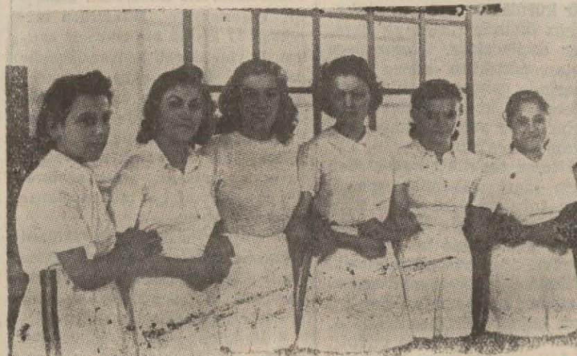
Dün, maçlara iştirak edenlerden bir grup (Yazısı 4 incede)