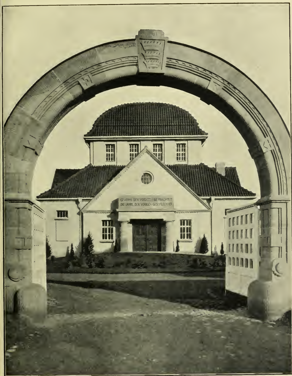
Portal und Versammlungshalle des neuen Friedhofs der Wormser jüd. Gemeinde.