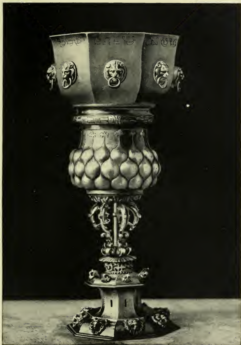
Becher aus 1609 des Wormser Männer-Wohltätigkeitsvereins.