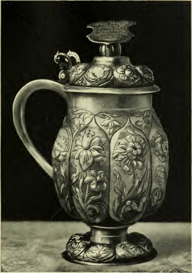
Kanne aus 1710 des Wormser Männerwohltätigkeitsvereins.