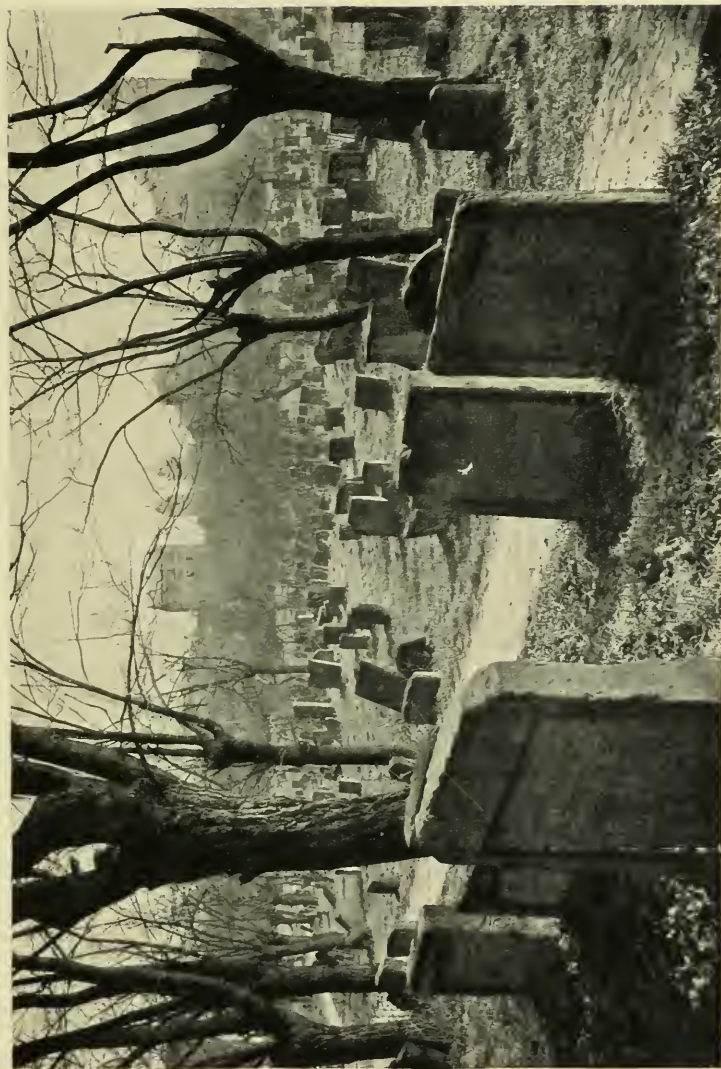
Alter Friedhof der Wormser jüdischen Gemeinde.