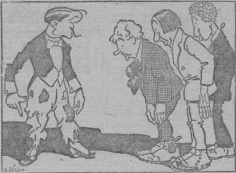
Теляковский: Господа, какая может быть гримаса...