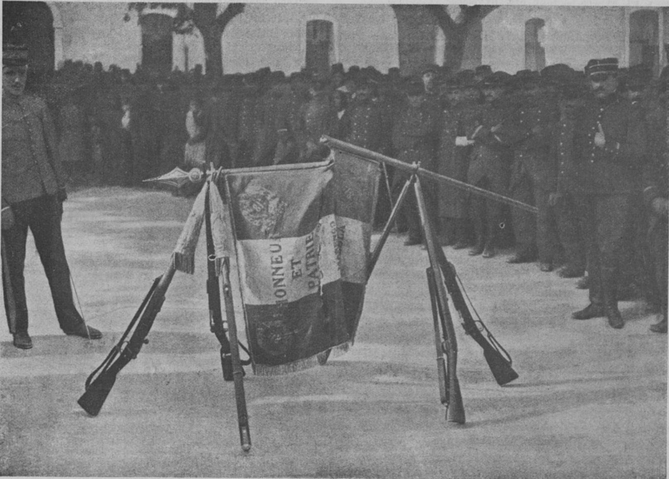
Знамя 81-го пѣх. французскаго полка, перебитое непріятельскимъ осколкомъ.

Съ ними вступили въ бой находившіяся на мѣстѣ сторожевыя англійскія суда. Лишь только получены были