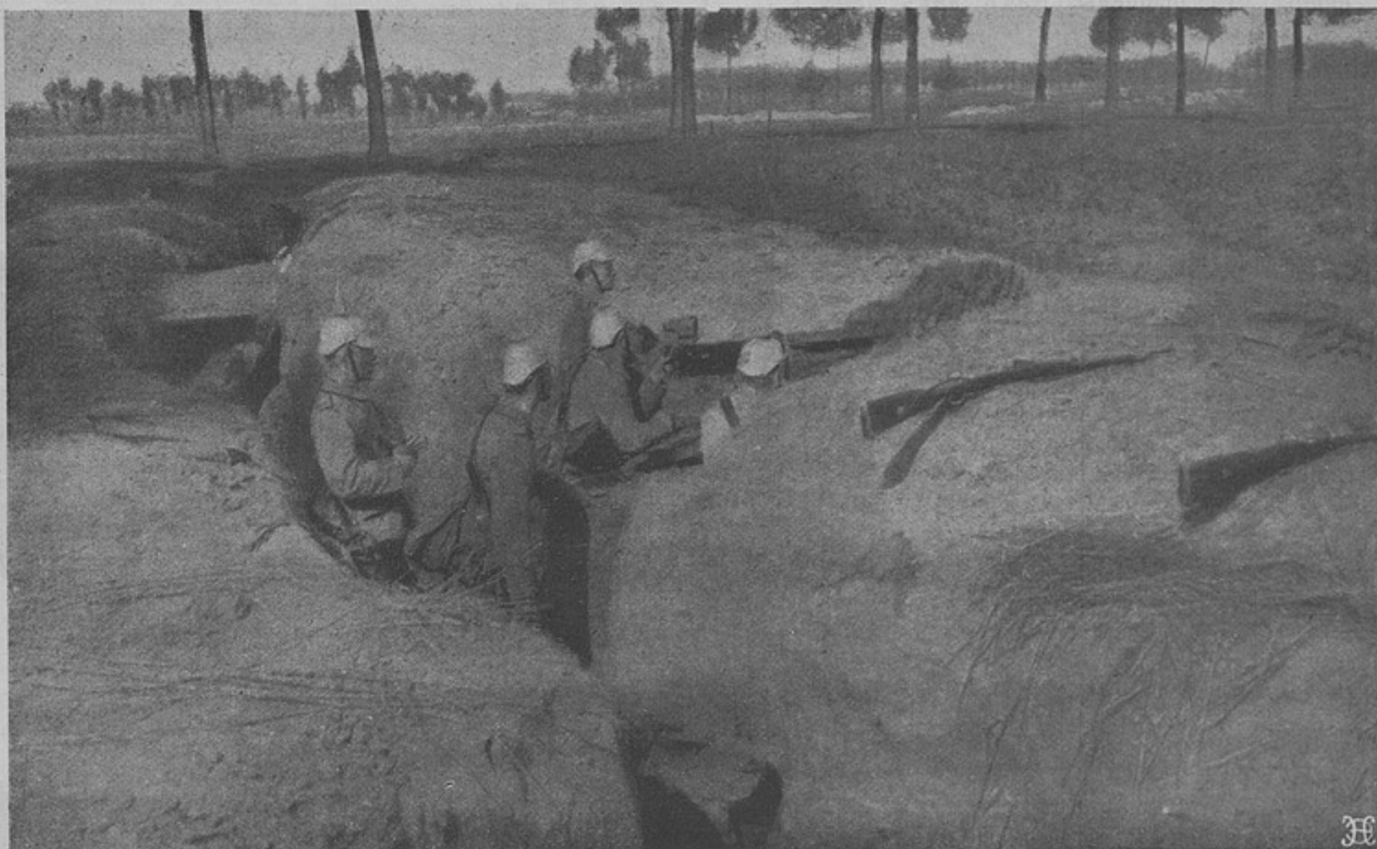
Германскіе окопы подъ Антверпеномъ.

Среди стука колесъ канонада дѣлается неслышною.