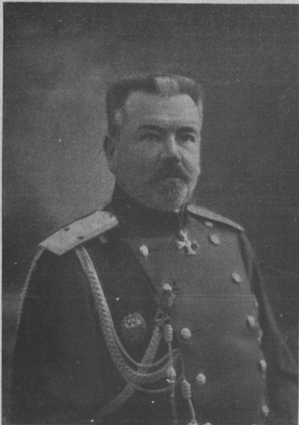
Помощникъ начальника канцеляріи военного министерства, ген. шт. генераль-лейтенантъ

СОДЕРЖАНИЕ: Портретъ генераль-лейтенанта Александра Сергѣевича Лукомскаго. — Распоряженія по военному вѣдомству. — Хроника. — Война 1914 года. — Обзоръ печати. — Корреспонденція. — Свѣдѣнія объ убитыхъ и раненыхъ. — Письмо въ редакцію. — Почтовый ящикъ. — Объявленія. — Высочайше приказы.