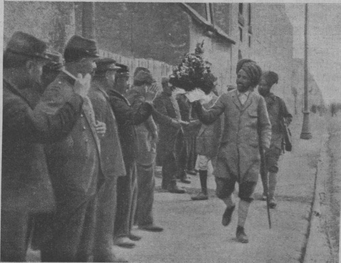
Привѣтъ французовъ герою индійскихъ войскъ.

— Прятали мужички, это вѣрно, но только больше