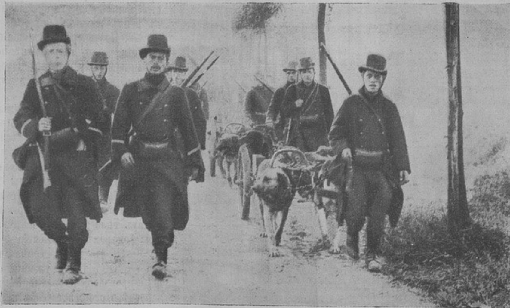
Бельгійскія войска, покидающія Антверпъ.

Въ бѣлыхъ короткихъ свиткахъ, надѣтыхъ сверхъ всего платья, пахари-русины привѣтливо снимали шапки, раскланиваясь съ нами.