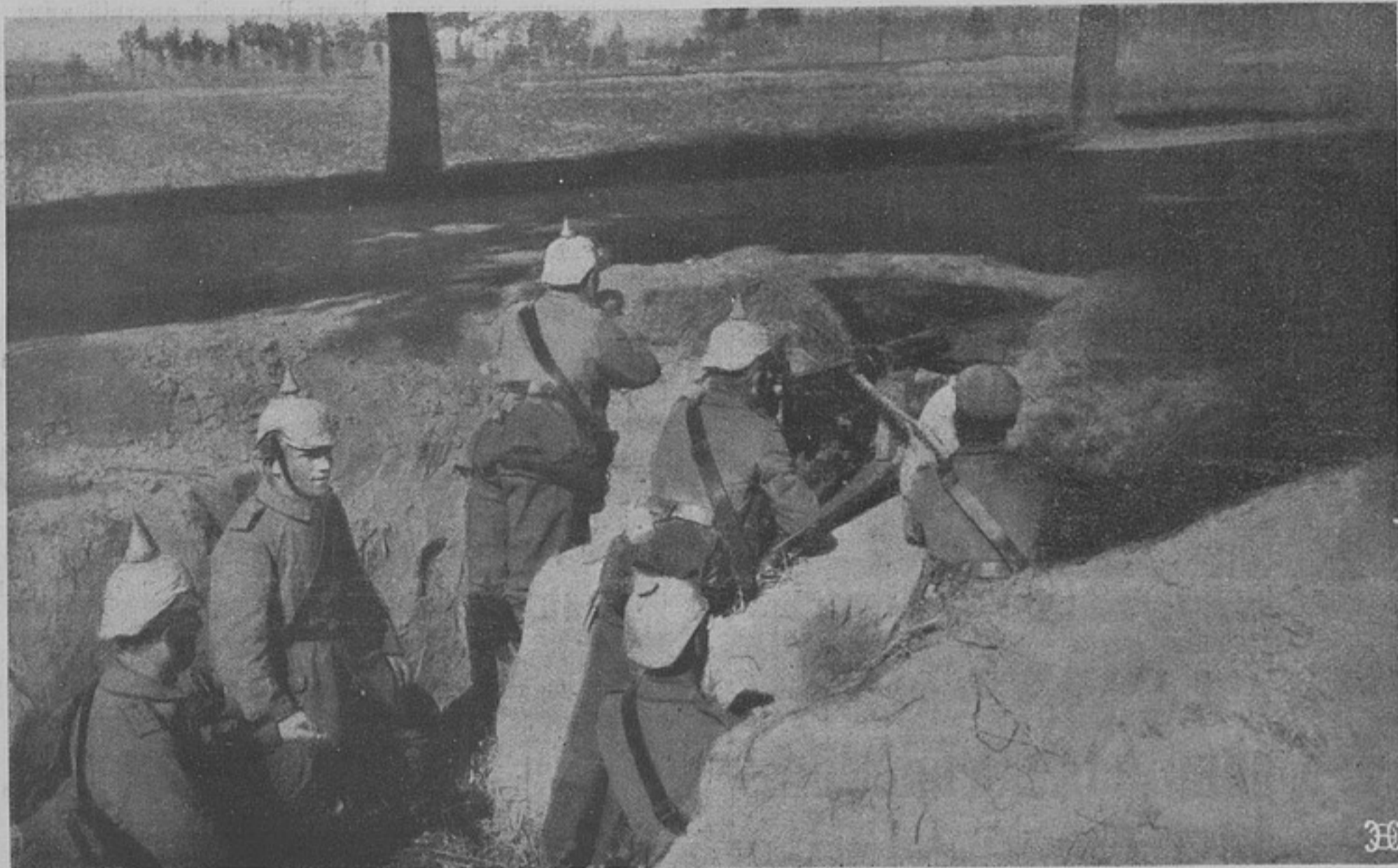
Германскіе пулеметчики подъ Антверпеномъ.

Страшныя муки видимо испытали эти австрійскіе обозные, раньше чѣмъ умереть.