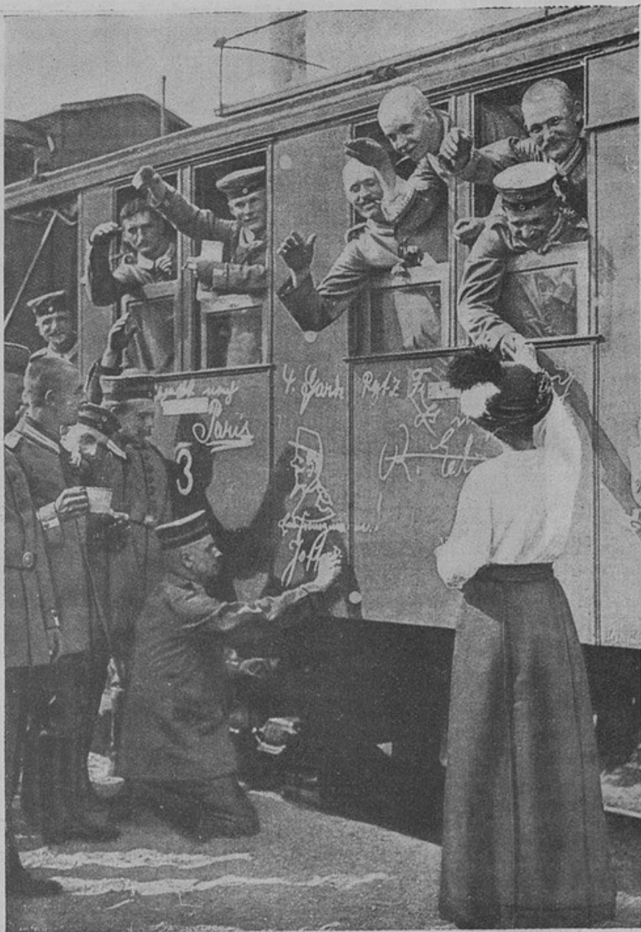
Германцы отправляются „nach Paris“.

— Ну я уже видѣлъ подобные пни въ Равѣ-Русской въ саду повятовой кассы, — презрительно отвѣтилъ поручикъ.