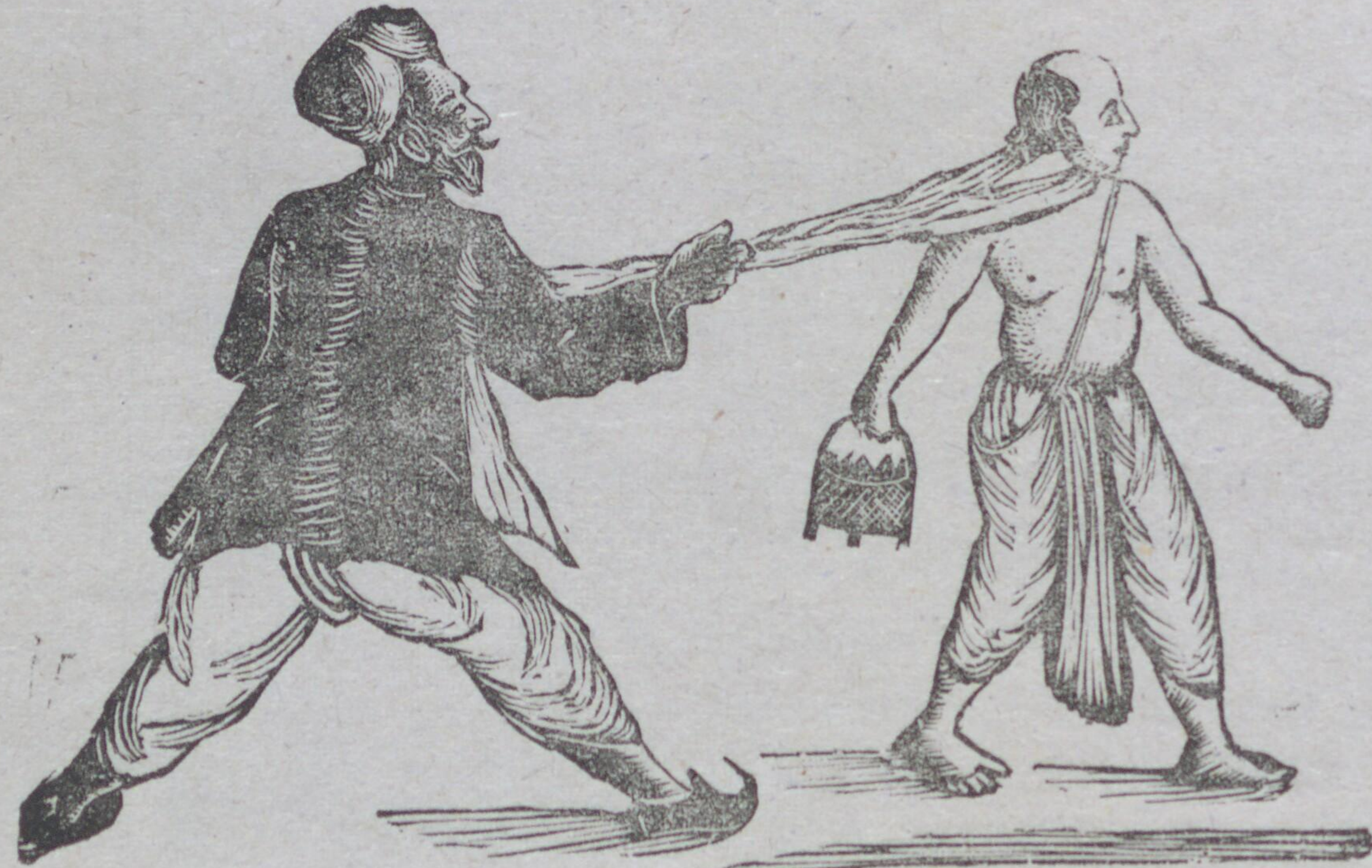
যায়েগা কাঁহা মুঝে ভোট দেনে হোগা