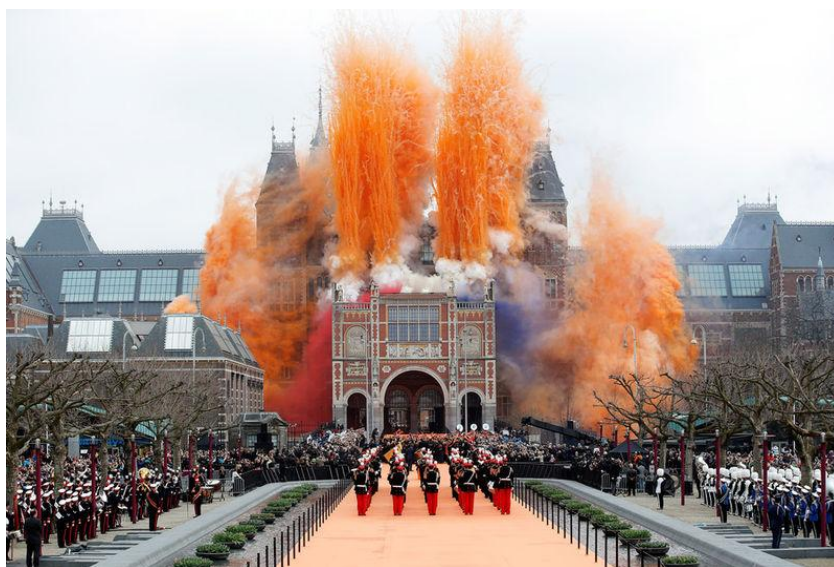
Rijksmuseum je výrazné i offline. Oslavy znovuotevření po rekonstrukci.

Trend je jasný: stále více lidských aktivit se přesouvá do online prostoru. Internet je první místo, kde dnes lidé hledají informace i vzdělání a tato tendence bude pravděpodobně dále sílit. To si uvědomuje i řada muzeí, která těmto změnám vychází vstříc. Špičkou ve využití online možností je zřejmě amsterodamské Rijksmuseum se svou aplikací Rijkstudio ( podívejte se na video ).