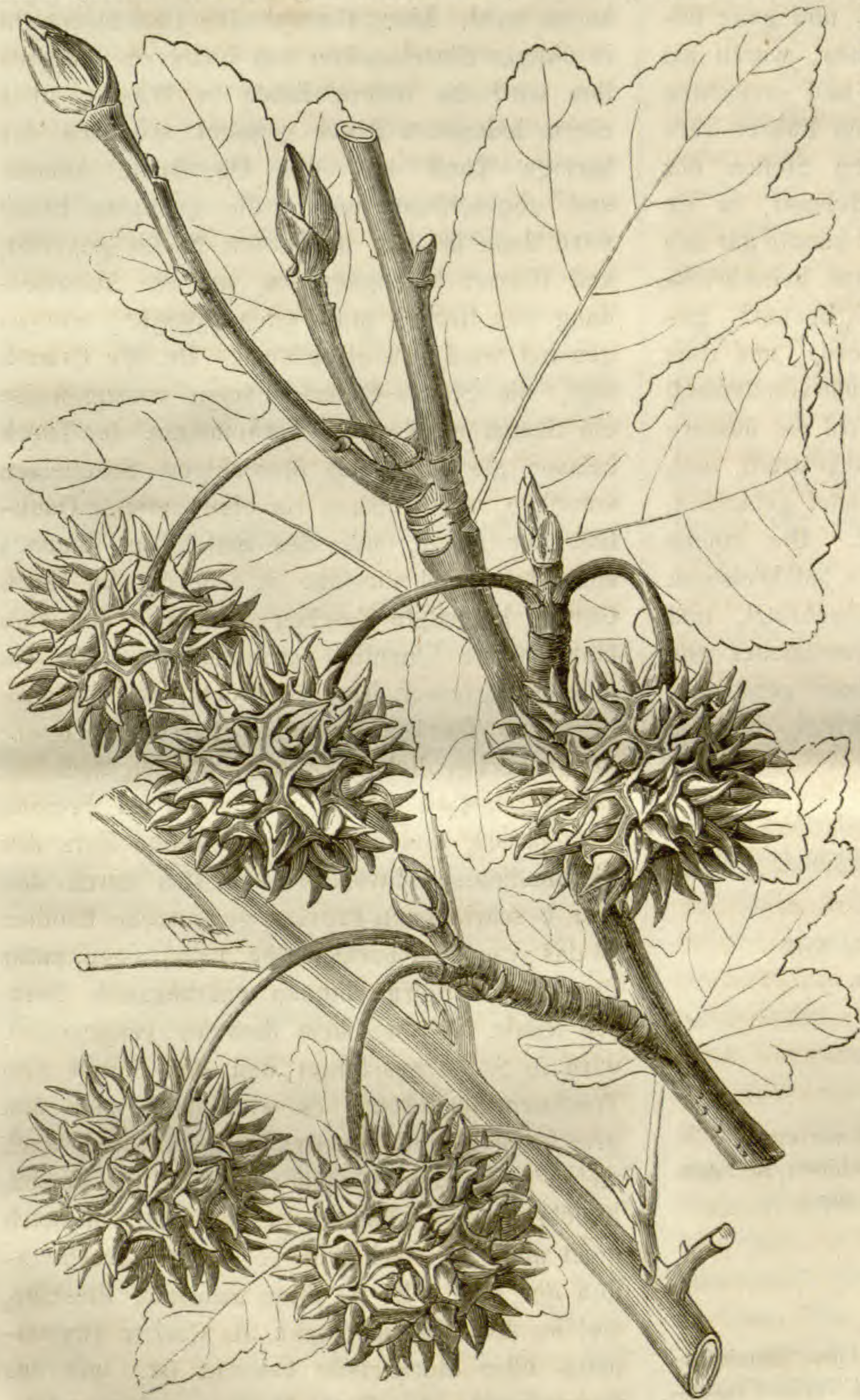
Liquidambar orientale, Mill.

Die Pflanze, von welcher der flüssige Storax gewonnen wird, ist, wie aus mir von Herrn Maltass übersendeten Exemplaren der Blätter und Früchte hervorgeht (siehe Holzschnitt!), Liquidambar orientale Miller (L. imberbe Ait.); der Baum findet sich in Wäldern südwestlich von Klein-Asien, — bei Melasso, im Gebiete von Sighala, bei Moughla, und bei Giova und Ulla im Golfe von Giova, auch in der Nähe von Marmorizza und Isgengak — zwei Rhodos gegenüberliegenden Orten. Hr. Maltass passirte am 7. und 8. Mai 1851, und zwischen dem Dorfe Caponisi und der Stadt Moughla einen dichten Wald desselben, den er als aus Bäumen bestehend beschreibt, die der Platane (Platanus) ähneln, doch ein kleineres Blatt und weit dichteres Laub haben, als das der Platane gemeinlich sei. „Ich bemerkte auch,“ fügt er hinzu, „dass der Stamm der meisten der grösseren Bäume von ihrer äusseren Rinde entblösst, und