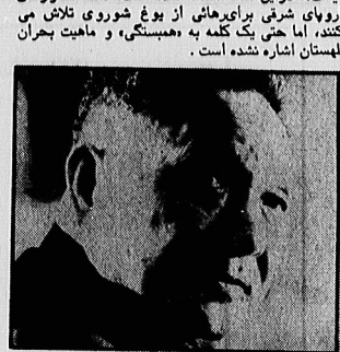
دکتر شیائونگ مرد نیرومند رژیم چین - آیا او از دستگاری رهبری کتاریستی خواهد کرد؟

سفر ژورنالیست به چین، آمریکا را از احتمال نزدیکی چین به شوروی به وحشت خواهد انداخت