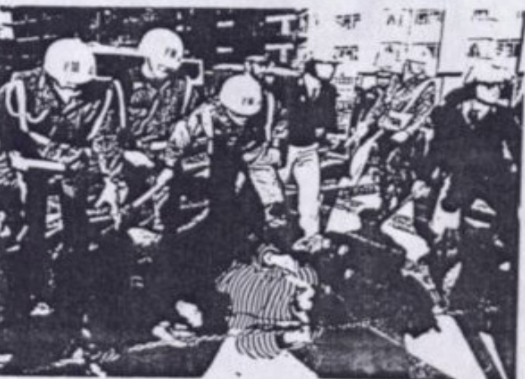
1. se quedarán en el U. Urra.

Afirmamos la necesidad y el derecho que todo pueblo oprimido tiene de valerse de todos los medios que están a su alcance, y por consiguiente de las armas, para hacer frente a quién lo explota. Y consecuentemente, creemos que la única manera de que un pueblo garantice su integridad y libertad, tanto nacional como social, será a través de la creación de un poder político-militar bien estructurado organizado y con una política coherente.