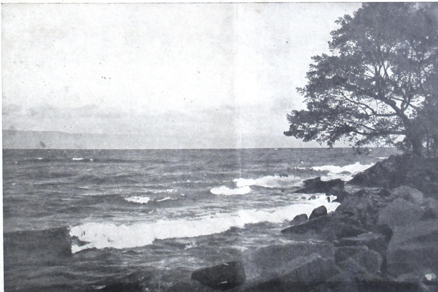
1928 30, 1928, 14, 1928, III.