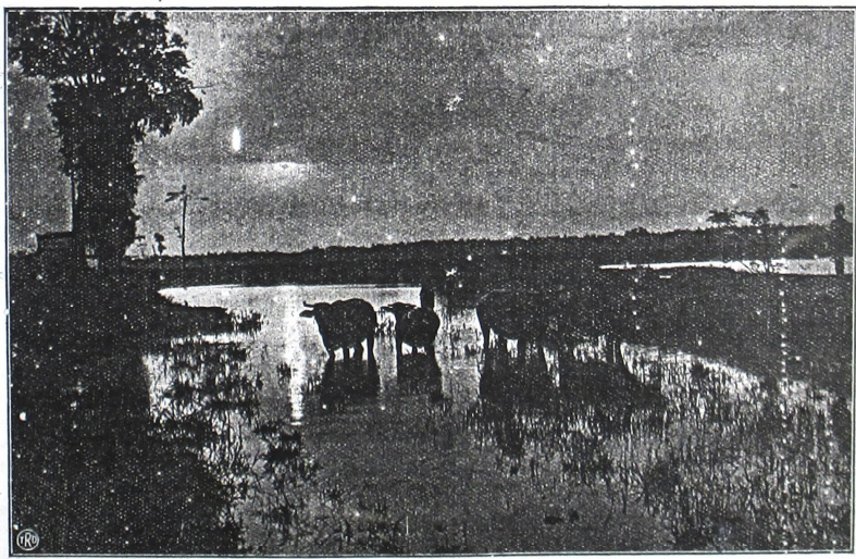
ဤ ပုံများကို ပုံနှိပ်ရေးရုံးမှ ပြန်လည်ထုတ်ဝေပြီးနောက် မိမိတို့အတွက် အရေးကြီးသော အချက်အလက်များကို ဖော်ပြပါရှိပါသည်။