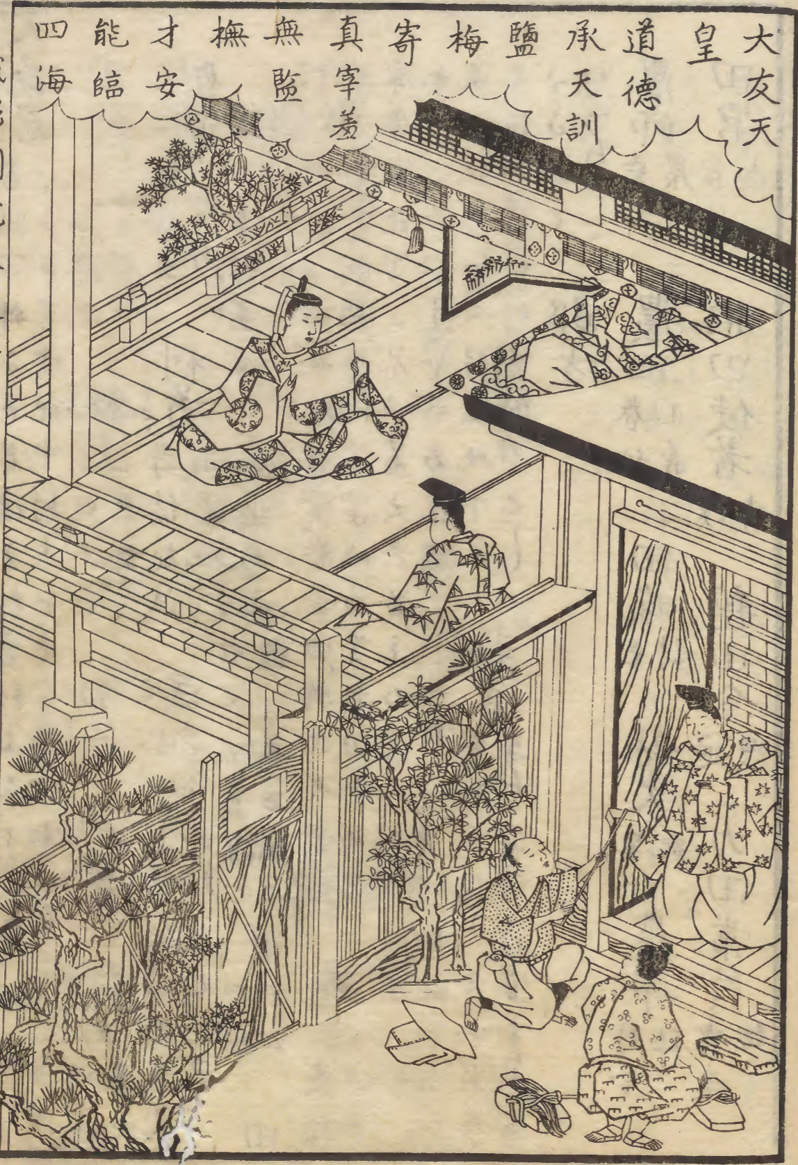
成形成圖說卷之一

の嘉とまもふ神樂とのこたの樂とるやせ又見ハ何 たる物とわらふ子孫繁昌の子やとのまとい尺二 寸よといとて申とくおめてはりたり飯といと 一りいともりあり 四神舞ハ面とかけ頭ハ籠篋といひ りて舞禮月令季秋命冢宰舉五穀之要歲帝藉之收于神 倉註要者租賦所入之數藉田所收歸之神倉將以供粢盛 也漢置藉田倉供粢盛置令丞即古甸師唐宋曰神倉羣邑 每以乙未祀先農○事物紀原云今人以歲十月農功畢里 社致酒食以報田神因相與飲樂世謂社禮始於周人之蜡 云