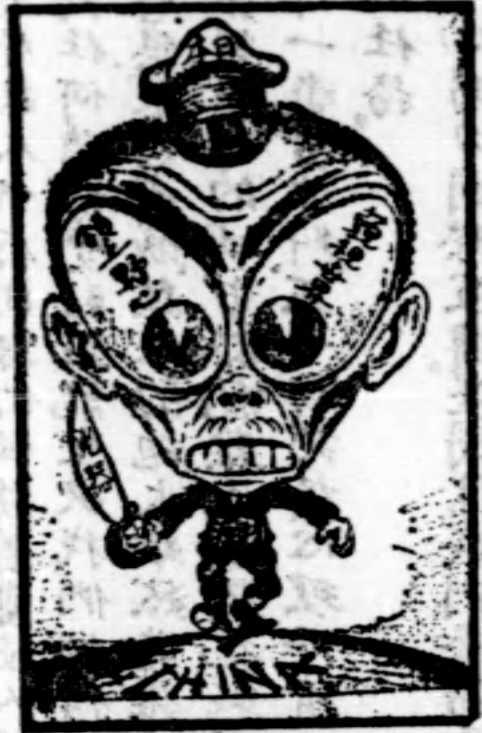
巨頭怪物 東海陸軍 大自陸軍 末有陸軍 果自陸軍 殊大自陸 頭小大自 身力小大 操力小大 體力小大 甘不自尋 路不自尋