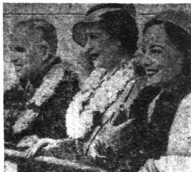
卓別麟與寶蓮露達及哥達均母 親合影

關於這件事，有人說也許不至於這樣，因為最近他才說過或者要拍一部影片，他自己也要開口對白呢。