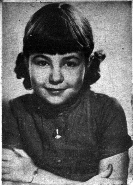
琴惠歌 Jane Withers