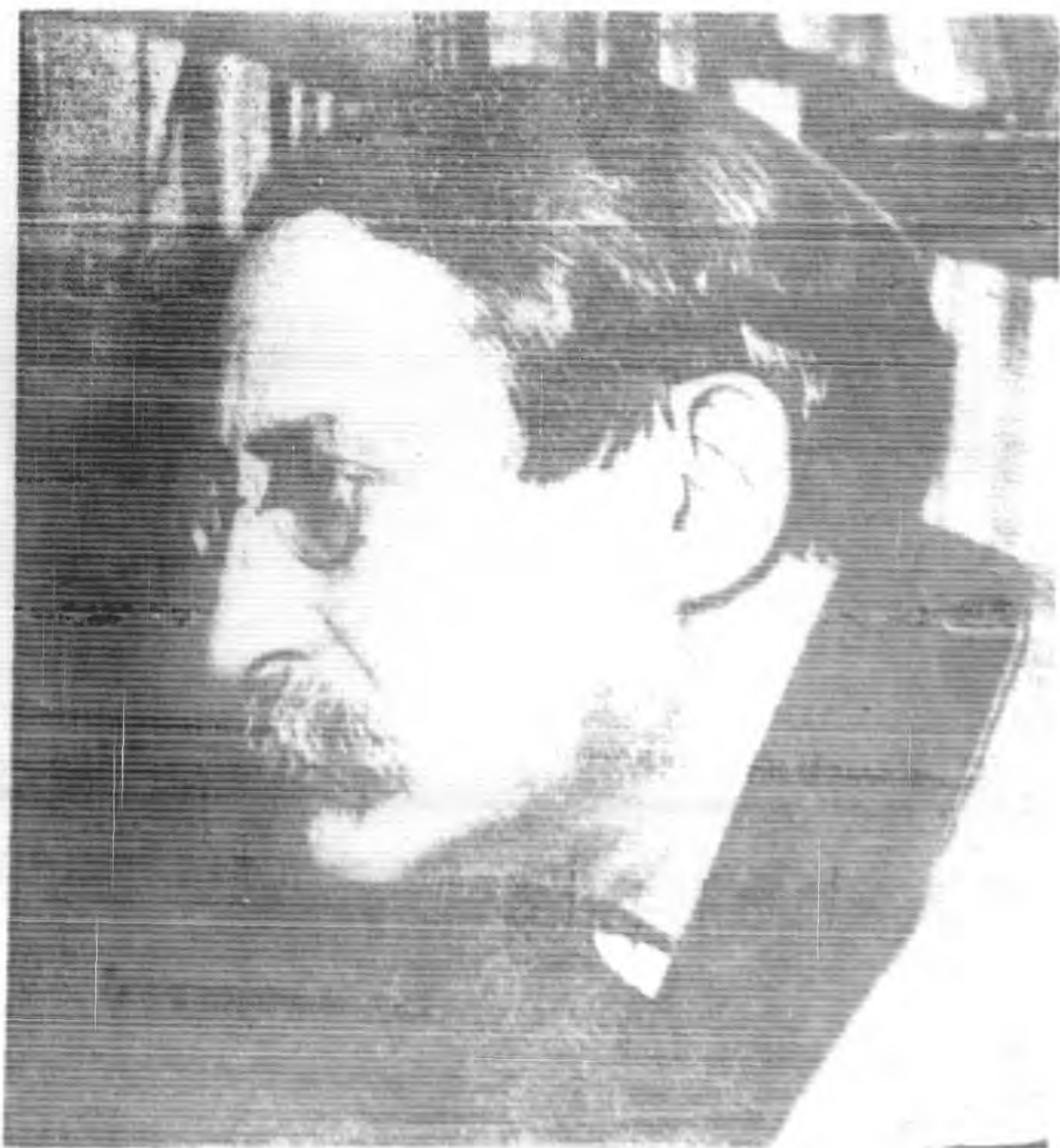
影 近 倫 伯 昂 李 理 總 法