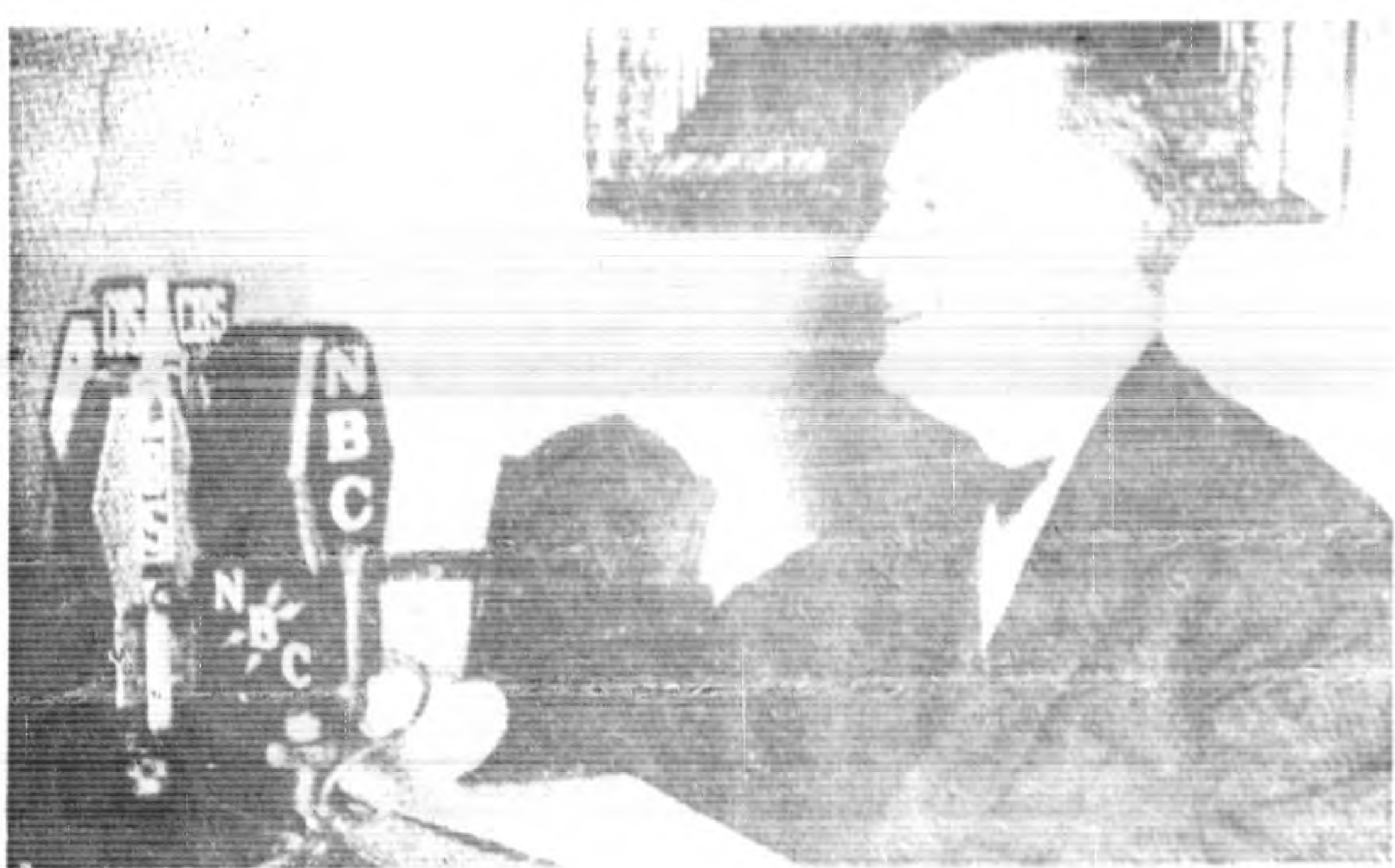
美 國 駐 菲 領 事 勞 斯 福 菲 選 勝 利 接 造 像