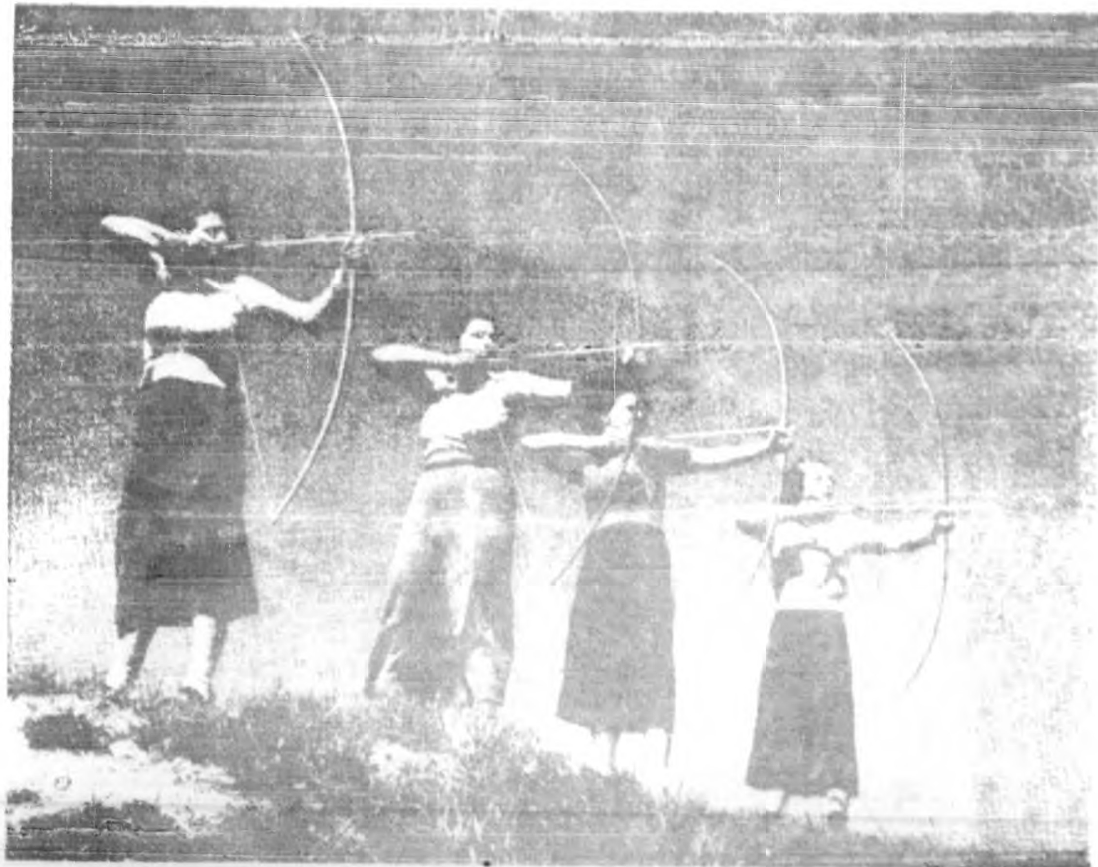
影畫矢弓習學女歸國美