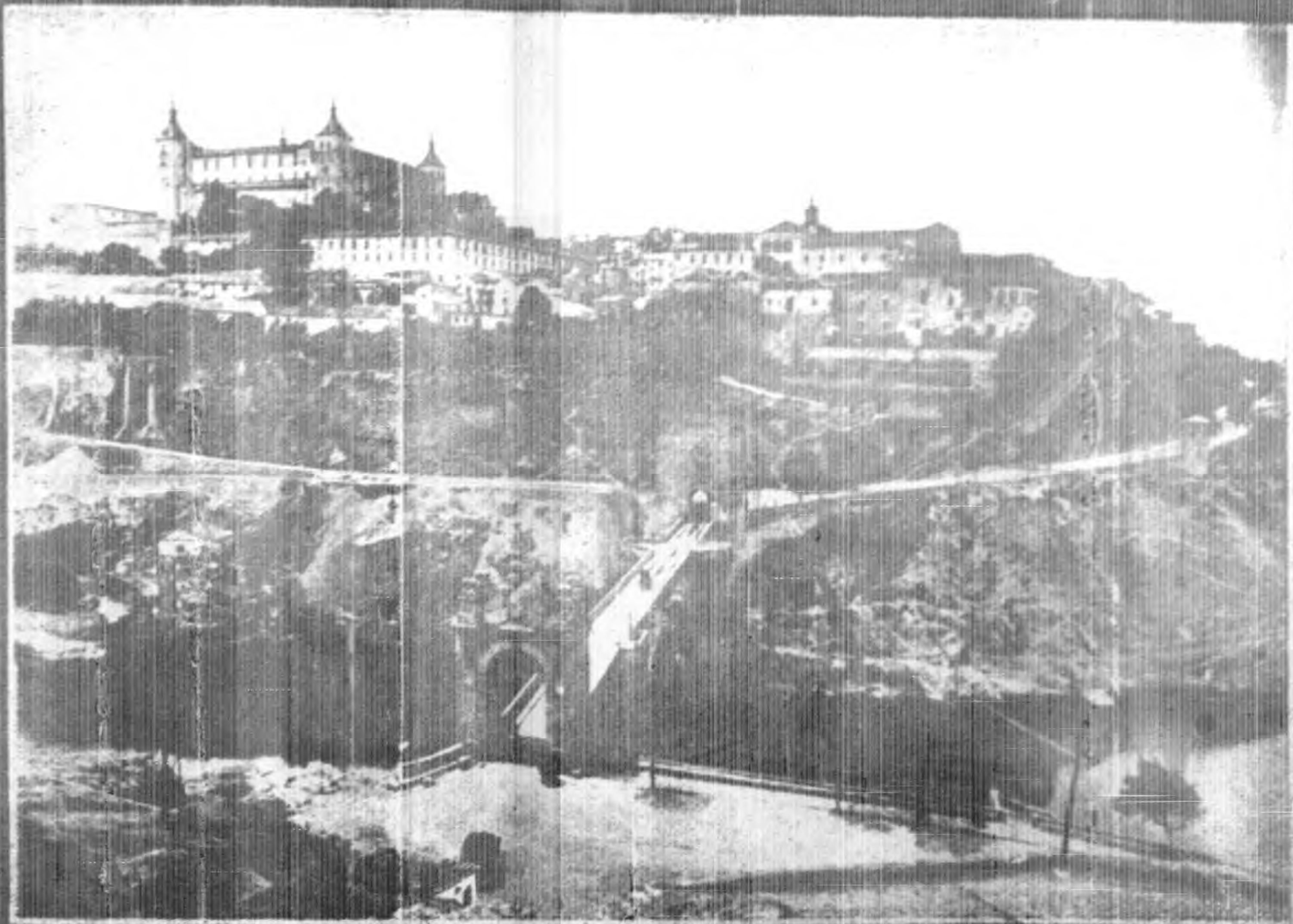
西 班 牙 美 麗 之 建 築 拓 影 現 已 及 于 內 戰