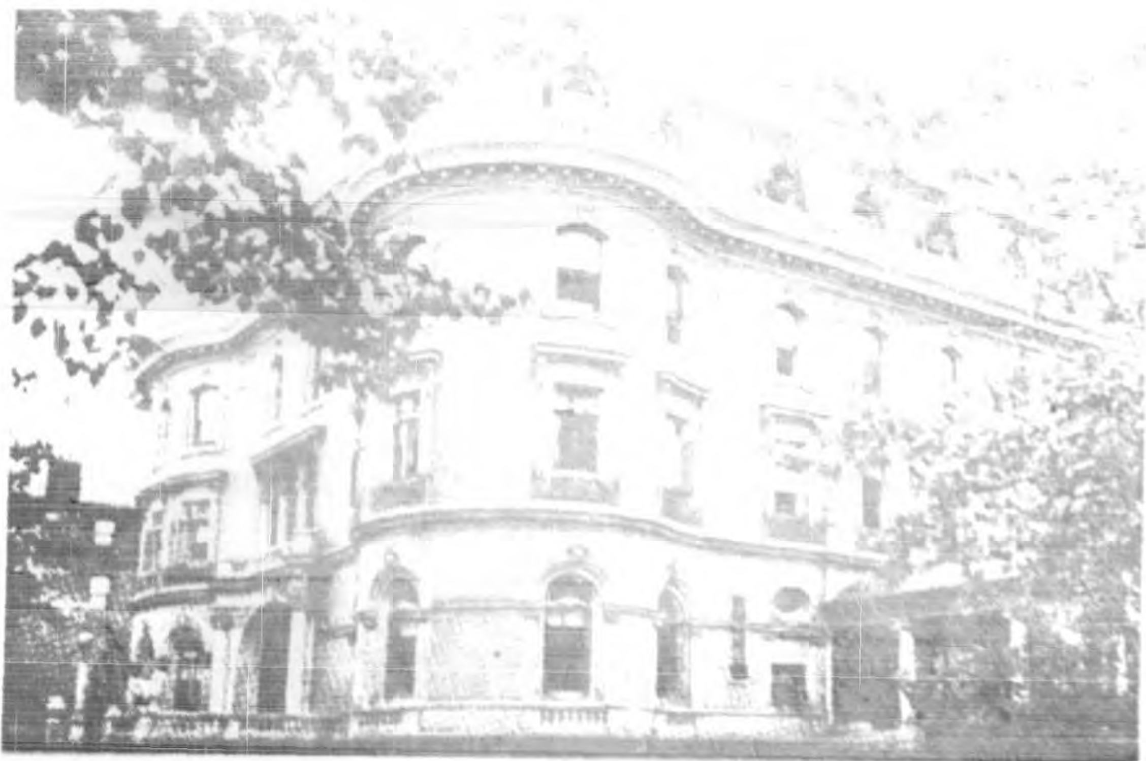
寫本大之政新國美