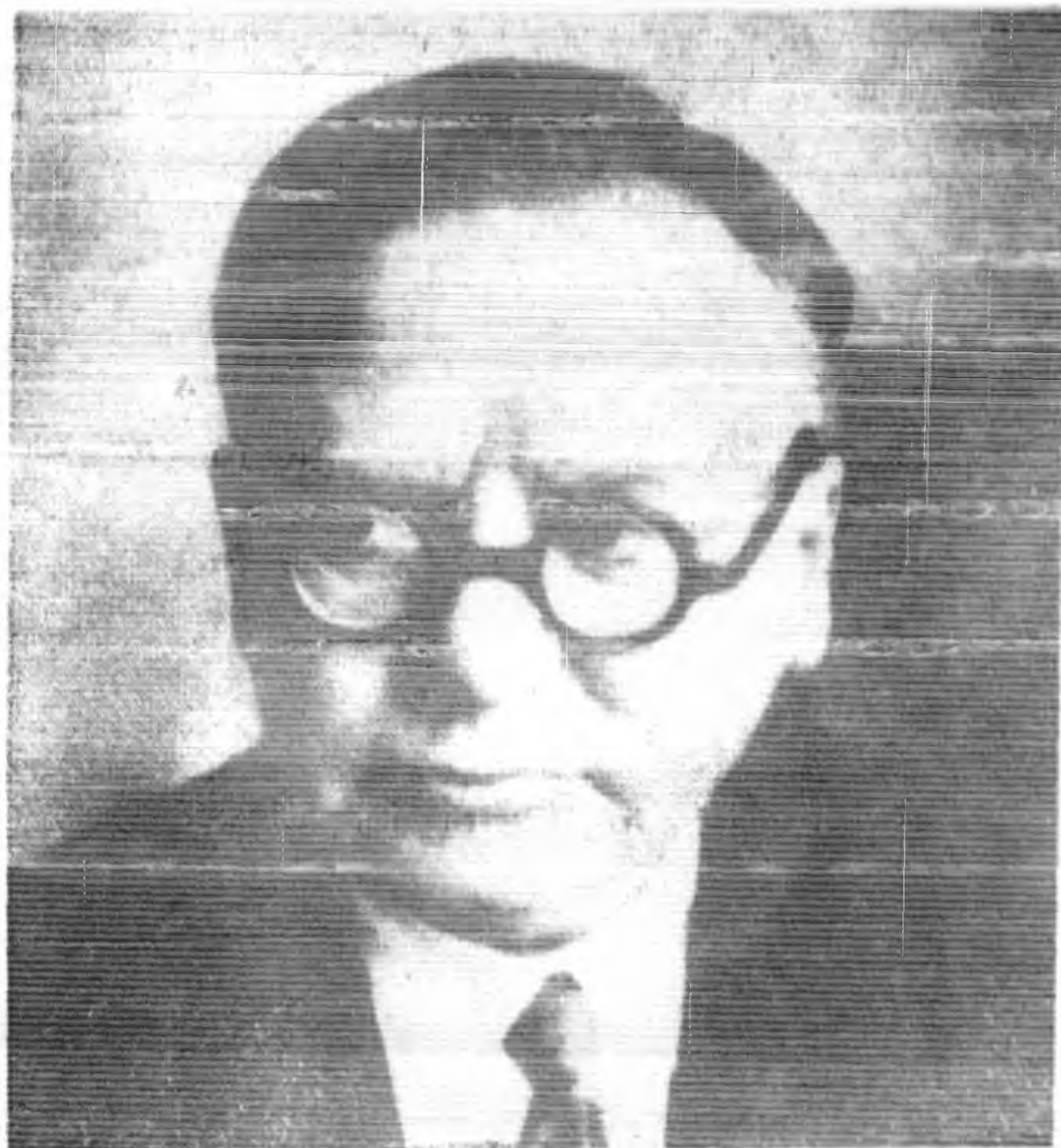
照 近 夫 諾 維 李 長 外 國 俄