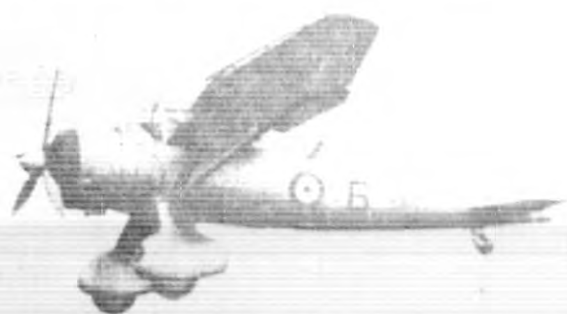
英 國 每 小 時 可 飛 三 百 三 十 里 之 新 戰 機