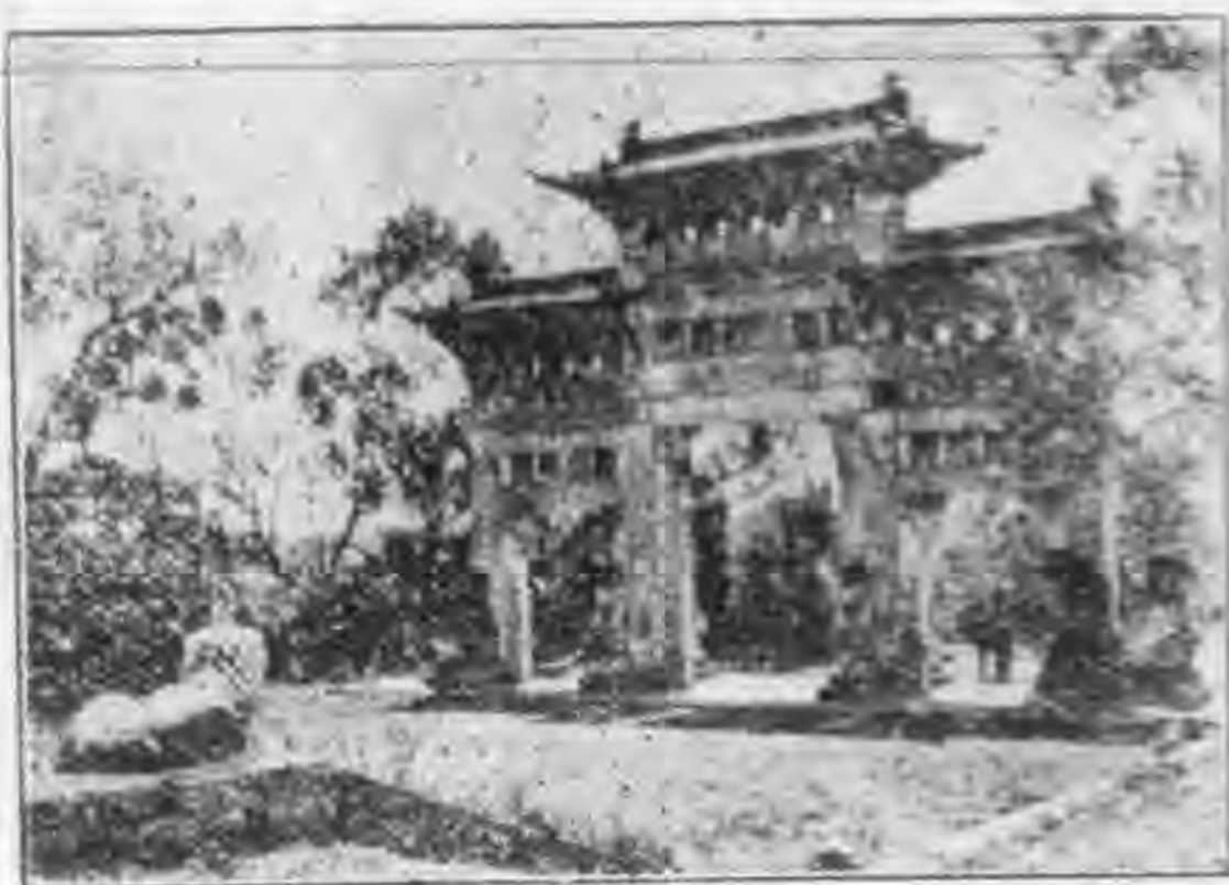
北陵入口之大理石碑

木牌，進大門有一架飛機陳列着，古宮而陳列飛機，意思或在於表示東北航空的進步，東北之進步不單航空，但惜乎都有點繡花枕頭草肚皮，所以雖有飛機二百餘架，除以一架陳列於古宮示衆之外，其餘的就一概作送日本的中秋節禮了。從北平運回的古董寶貝沒福見到，只見到幾十幅一位女畫家臨繪的各代皇帝像，有人在一幅一幅拜覽之後，付下結論曰：清朝之亡，看了這許多像就明白，因為到了咸豐同治的面貌身材，就已沒有康熙乾隆那麼英武