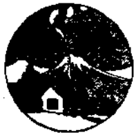
中國郵史上的又一奇蹟