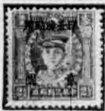
•二分二士版商務 元改分像烈務