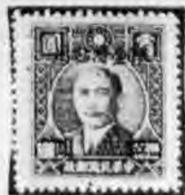
•元改百版申大 五元一一東