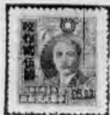
•元廿元一物農大 五改百圖作東