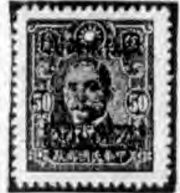
•元千五萬一作改角一版信中• •元萬三作改角三版信中• •元萬二作改角五版信中•

又發行中信版五角改作二萬元長框票（水）一種；此項五角票原有有條紋土紙、無條紋土紙二種，有條紋土紙之齒度，且有十一度、十一度半、十三度、十三度半、四種，今售者有條紋十三度、十三度半已見之，無條紋者均為十三度。 八月十二日滬局窗口發售中信版三角改作三萬元長框票（水）一種；此項三角票原有中國道林紙、有條紋土紙、無條紋土紙、三種，有條紋土紙之齒度，且有十度半、十一度、十三度、三種，現見者僅有條紋十三度一種。 八月十四日滬局窗口發售中信版一角改作一萬五千元長框票（水）一種；此項一角票原有中國道林紙、有條紋土紙二種，中國道林紙之齒度且有十二度半、十三度、二種，今售者為中國道林紙之十三度者。 八月十六日滬局發行招商局七十五週紀念郵票；圖案及說明見上期。未用紀念戳。