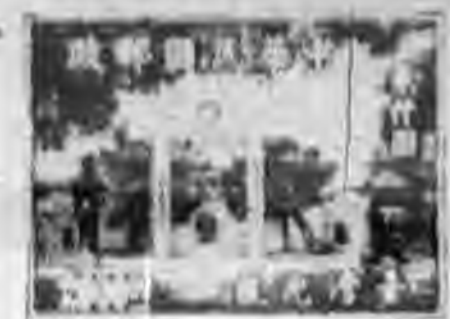
台灣光復紀念郵票之另一樣式

月二十五日台灣光復節發行。票面分五百元及一千二百五十元兩種，五百元者印紅色，計二百萬枚，一千二百五十元者印綠色，計一百五十萬枚。另一圖案，則擬在台北市中山堂及延平郡王鄭成功祠二種中，交印刷廠擇優付印，經數度推選，採用台北市中山堂，於三十七年四月間發行，票面分五百元及一萬元兩種，五千元者印青蓮色，計二百萬枚，一萬元者印橘紅色，計一百五十萬枚。是項郵票，連同前發得五百元及一千二百五十元兩種，並無加蓋「限東北貼用」及「限台灣省貼用」字樣者。一併售至三十七年十月底為止。當籌印台灣光復紀念郵票時，亦擬發行東北光復紀念郵票，但東北局勢，始終未見澄清，不得不暫緩辦理，在不久的將來，其望終能與郵人見面。