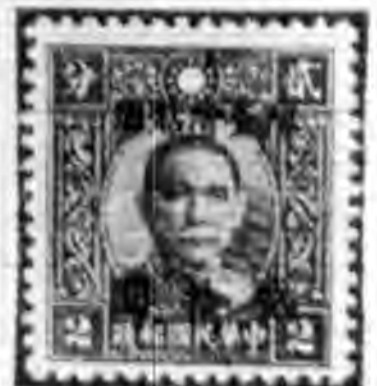
•十改二再中 元二分版華