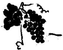
這是一個「神秘之邦」 郵票圖案也多怪異難辨