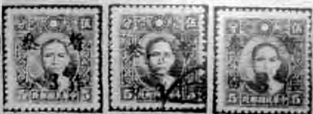
蓋加蘇甘造杜 蓋加湖浙造杜 蓋加滬何造杜

暫作三分票除上海、湖南未見爲品外，其餘各區均有低品或杜造者。乃因分區加蓋暫作郵票，此爲第一遭，外埠不明上海真納，來票極少，而其時戰事關係，上海游資匯潮，郵票亦成囤積對象之一，更兼上海暫作三分滬局無端限制四套以至一套，尤爲影響郵人心理，因之各區暫作三分到滬，爭先搶購，每枚售至一二元之高，致爲青小輩輩，或仿樣偽造如江西、浙江、重慶之票三均有之，且有個蓋等等變體，或完全出於杜造，如甘肅暫三向未到滬，作偽者即杜造一種暫作三分，冒稱甘肅加蓋，河南及蘇州根本無暫三發行，作偽者亦杜造而冒稱此二區者，此皆利用當時郵人見票搶購之心理，而施其鬼域技倆故耳。仿樣偽造之票細心比較便可察出，杜造之票則無從比較。惟各地暫三之字形及原票種類，已詳上文，其有字形不符或原票種類不符者，非爲這即杜造之票，亦勿誤以爲不見經傳之品，自費一番款項也。