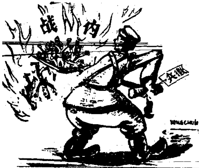
好幾份子的瘋狂 華作

但是在大多數答覆中，雖然對於現在世界的精神道德表示不滿，但他們並不失望，他們都看出在人民反對法西斯爭取和平民主的鬥爭中是出現了新的精神道德。「在中國的解放區內，封建專制解除了，人民普遍有機會受到教育，買賣婚姻的消滅，娼妓的絕跡，婦女在家庭中地位的提昇，人民的自由的自由得到了保障，人與人間充滿了團結互助，友愛，建立了合理的平等的和睦的關係。」（某政治研究團體）